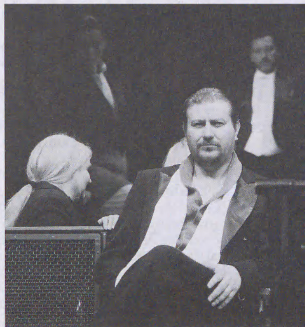
Schiller Kata felvétele

estje, a XX. század , amely korának szinte kötelező előadásává válhatott. Más szempontból a Krétakör Feketeországa is idesorolható, mivel napi hírekre reflektált. A TÁP Színház nagyvállalkozása, a színházi pénzek elosztásáról írt jelenetekből álló Kurátorok is tematikailag illeszkedik a sorba. Mindegyik előadásban fontos a montázs, vagyis az a szemlélet, amely a múltat nem ok-okozatok nyilvánvaló láncolataként, hanem egy lehetséges verzióként fogja fel. Bár mindenütt a téma az, ami különösen aktuális, de nem állnak meg ezen a szinten – mindig bizonyos általánosabb kérdéseket is boncolgatnak.