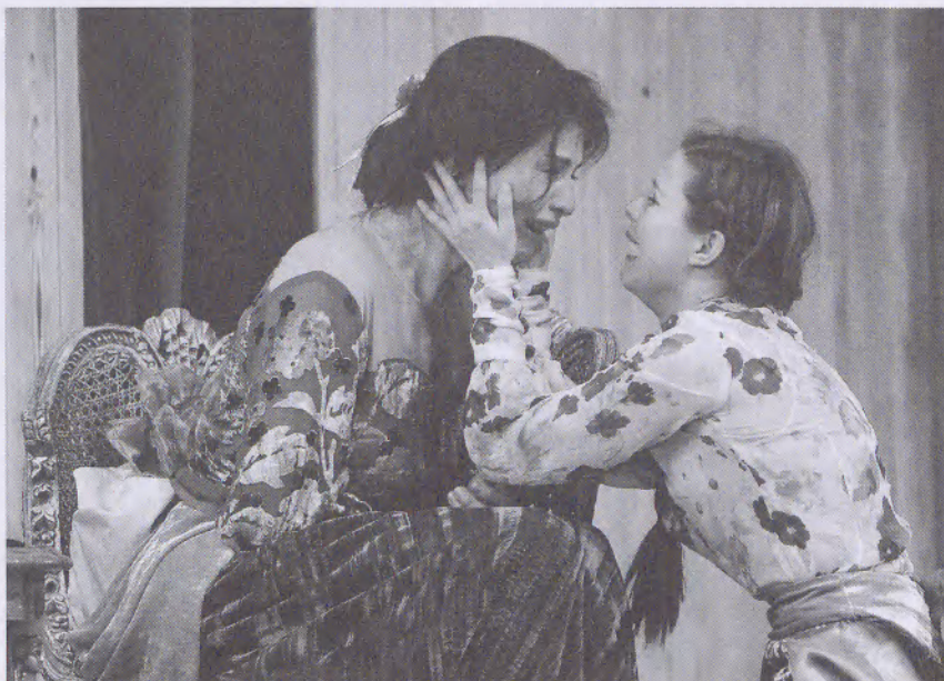
Nagy Akos Balázs – pointerfilm.hu

nosztalgikusan szép, szinte valóban élhető közeget. Máris markáns alkotói állásfoglalás az itt élők mellett, Lopahinnal szemben: aki ezt a gyönyörűséget le akarja romboltatni, vagy őrült, vagy szívtelen. Pedig a helyzet – különösen, ha a vázolt aktuális vonatkozásokat is számításba kívánja venni a rendező – ennél jóval összetettebb. Csehov darabja ugyanis éppen az érzelmek befolyásolta és a ráción alapuló világlátás ütköztetésére kínál lehetőséget, ráadásul úgy, hogy Ranyevszkaja és Lopahin érvelése is helytálló a maga módján. A nézői szimpátia azonban legkésőbb Ranyevszkaja királynői antréjánál a család oldalára áll, megbomlik a Csehovnál olyan kényesen felépített egyensúly, és sérül a szerzői szándék, melyet papíron Jordán is akceptál, miszerint a Cseresznyéskert komédia volna. A gogoli „Mit röhögtök? Magatokon röhögtök!” csehovi lecsapódásának („Nézzétek meg magatokat!”) önironikus légköre ilyen körülmények között nem tud megteremtődni. Sóvár fájdalom, könnyfakasztó nosztalgia lép a helyébe.