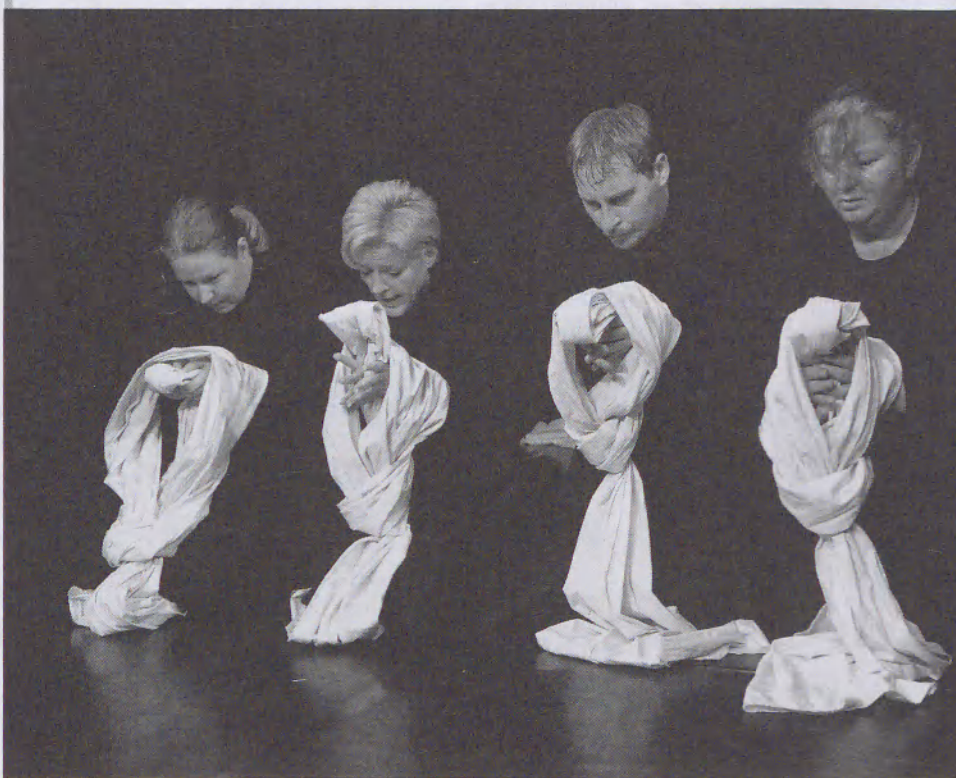
LENT: Metamorfózis (Vaskakas Bábszínház)

fesztivál utolsó napján bepillanthattunk még egy kakukktojás előadásba is: a kecskeméti Tintaló Társulat apró cirkuszsátrat állított fel a Sirály emeletén. Belül a gyerekek ülhetek, kívülről, erre alkalmas leskelődőkön át pedig a felnőttek figyelheték a miniatűr cirkusz csodáit. Ezen a ponton olvadt össze szimbolikusan az egymással sokszor ügyetlenül szembeállított két irány: gyerekelőadás, avagy felnőttelőadás. Mindkettő. És remélhetőleg ezzel a fesztivállal az úgynevezett felnőttek érdeklődését is sikerült mélyrehatóan felkelteni a bábműfaj iránt, mely még igen sok tartalékot rejtget.