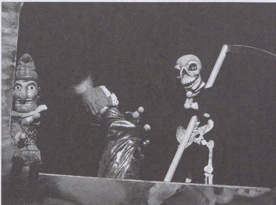
FENT: Punchék karácsonya