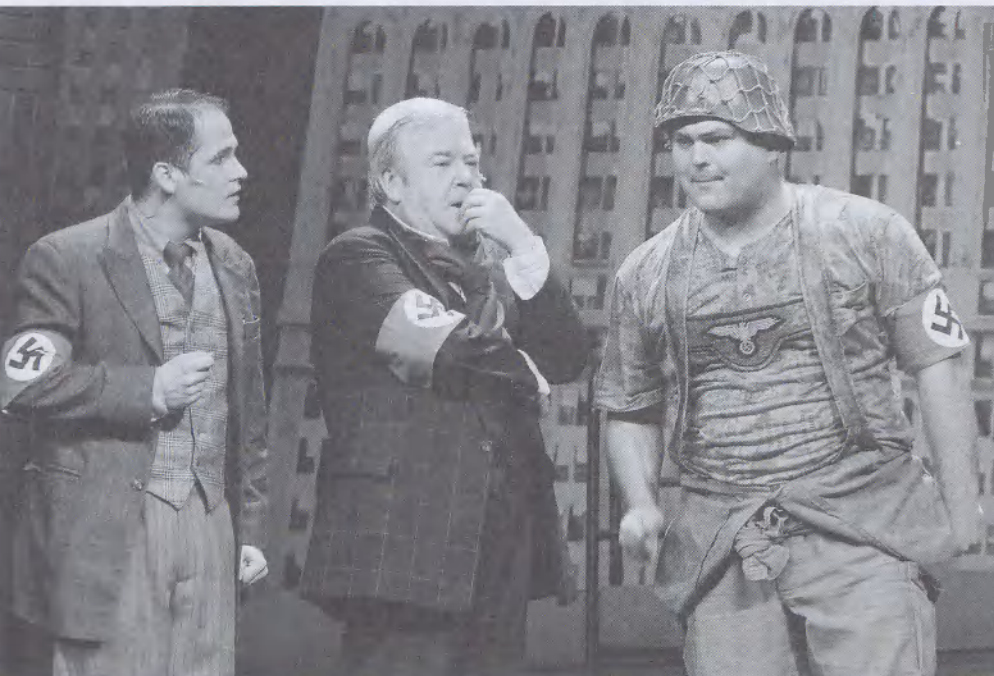
FENT: A Producerek a Madách Színházban