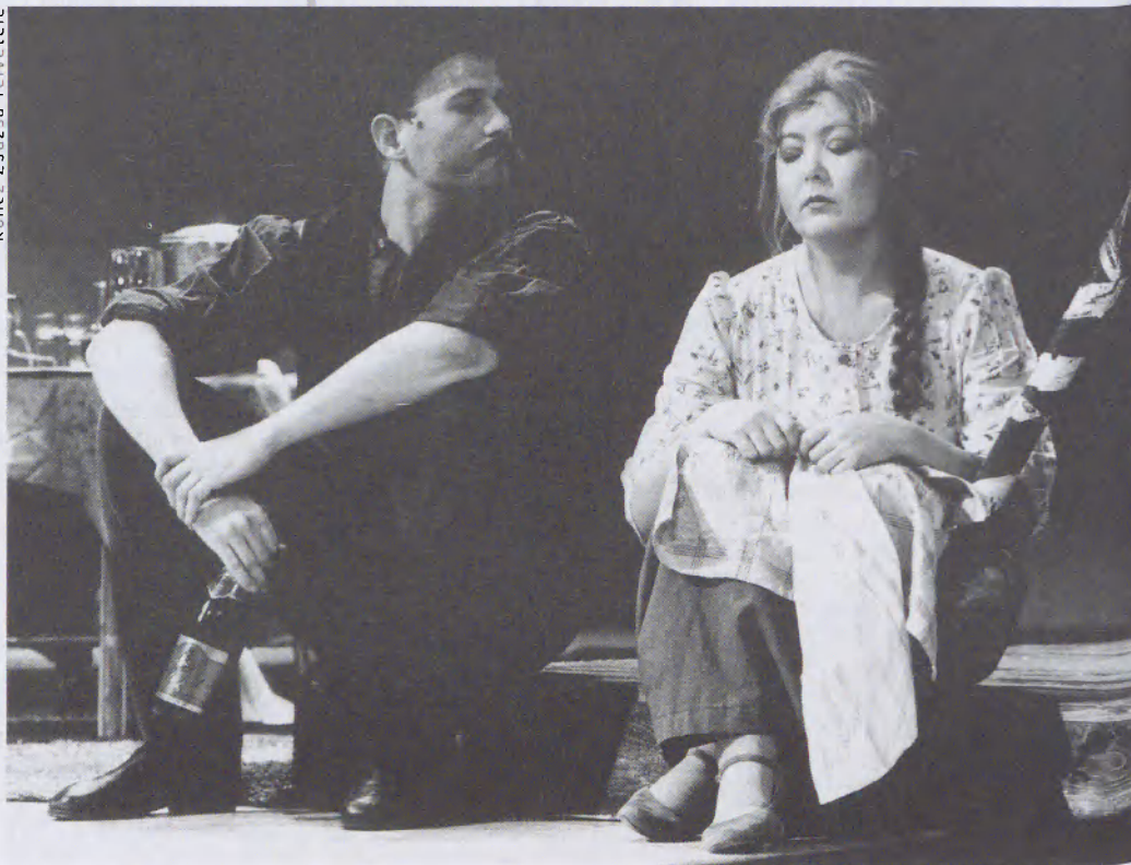
A Mágás Miska a Vígszínházban