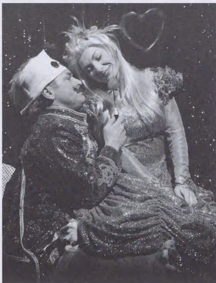
Schiller Kata felvételei

A közönség a cselekményt és a figurákat többnyire végtelenül archetipizálva és leegyszerűsítve kapja meg – az Operettszínház felismerte az idők szavát, és azt, hogy mire vevő a néző: az előadások jellemzően a technikailag lenyűgöző eszközparkot bevető külsőségekre (látványorientált koreográfia, effektekkel támogatott mozgó színpadi elemek, videoklipszerű montázs- és diszkó-világítástechnika) építenek. A dalokat átkötő prózai részeket lehetőleg annyira redukálják, hogy a szereplők (a dramaturgiai hiányosságokat pótolva) elmondhassák, mit miért tettek, így az előadások többnyire nem sokkal többek, mint egy szcenírozott koncert. Előfordul, hogy egy-egy produkcióra vendégként máshol játszó színészeket (természetesen „sztárokat”) hívnak –