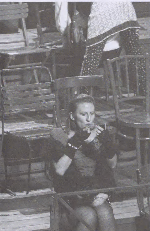
FENT: Kasimir és Karoline (nyíregyházi Móricz Zsigmond Színház)