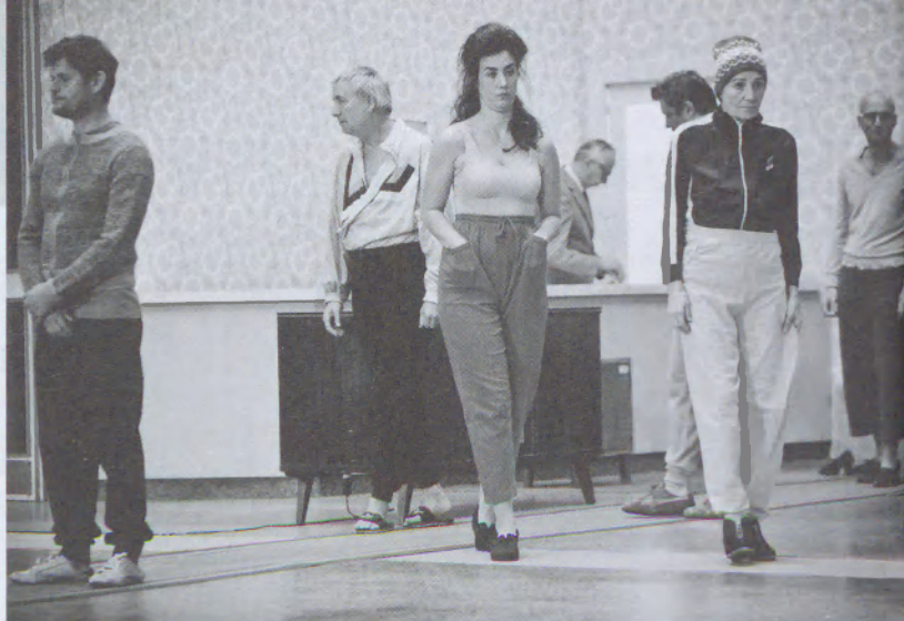
Az idióta című Nekrošius- rendezés