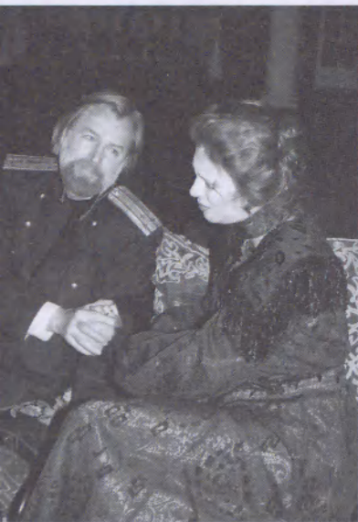
Jelenetek Jefremov Három nővér- rendezéséből

hogy kitűnjön valamivel, s mi mással lehetett akkor (1901) kitűnni, mint jó zaftos történetekkel. „Pi-pi-pi” – csúfolja folyton Tuzenbachot, s mohó gyűlölettel tekint rá. Mi ez a „pi-pi”? Ezzel piszkálták a junkerek és kadétkok laktanyáiban a melegeket [oroszul: petuh – ’kakas’].