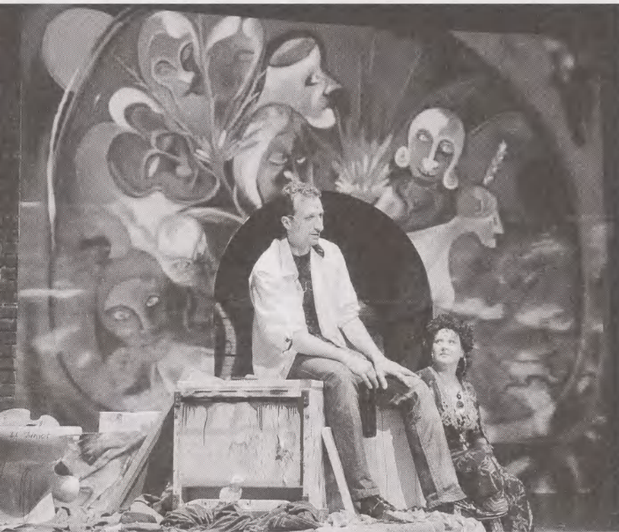
FENT: Cigánykerék (egri Gárdonyi Géza Színház)