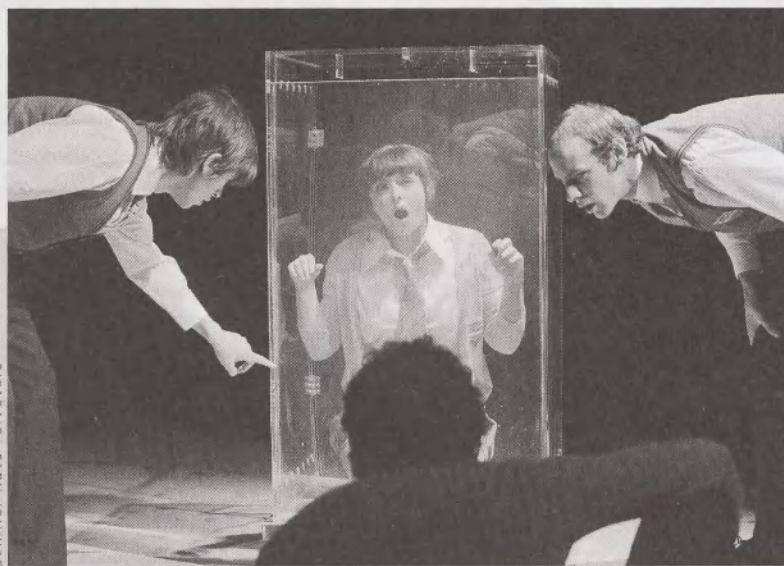
FENT: Az utolsó roma – egy utolsó cigány (KoMa Társulat)

A szórakoztató népszínművek világa kel életre a színpadon: a falusi kocsmában Kukac uram „a pénzemet én máma mind elmulatom” jellegével húzatja a talpalávalót, persze, amint elhallgat a muzsika, máris önfeledten bűdöscigányozik. Hiszen a cigány azért van, hogy mi mulathassunk – nagyjából száz évig ez volt az általános kép a cigányságról. És bár igen ritka már a hivatásos cigányprimás, mégis: a cigányság napjainkig szinte kizárólag a zenéjén keresztül kapott szerepet mind a színházban, mind a médiában; minden egyéb szempontból – és ez a politika mindenkori érdeke is volt – láthatatlan maradt. Többek között ennek is tulajdonítható, hogy