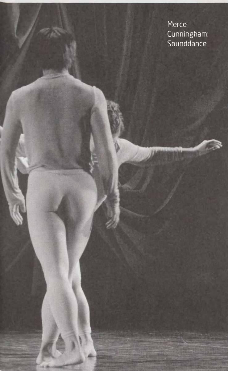
Merce Cunningham: Sounddance

Az alábbi írásban, amelynek végén sem érdemes majd definíciót keresni, arra teszek kísérletet, hogy röviden összefoglaljam, hogyan látom a ( színházi ) tánc