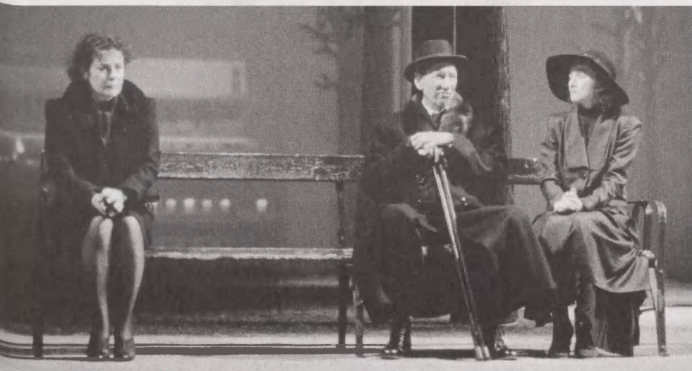
A Ritter, Dene Voss című darab az eredeti szereposztásban