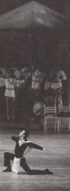
Rómeó és Júlia (Seregi László)