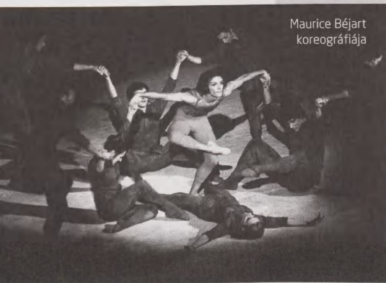
Maurice Béjart koreográfiája