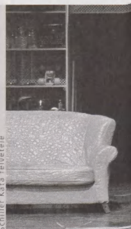
A Háló nélkül Tatabányán

talán azzal lehetne legjobban érzékeltetni, hogy a második felvonás poénforrását teljes egészében az a pillanatok alatt idegesítővé váló geg szolgáltatva, hogy a franciák a magyart „franciásan” törve (modorosán és rosszul) beszélnek.