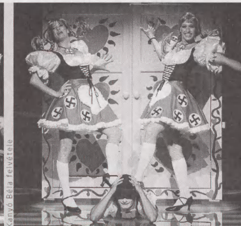
A Kabaré Győrben

zsolni, nem létező mélységeket belelátva a színre vitt anyagba. Természetesen vannak a műfajnak olyan darabjai, melyekből valóban születhetnek művészi értékű előadások. De ezek száma véges; a „drámázás” gesztusa a legtöbb esetben hiteltelenné, művivé, élettelenné teszi azokat a jeleneteket, párbeszédet, melyek a mű tónusához simuló interpretációban stílusosnak, frappánsnak, szellemesnek tünnének. A szabályt erősítő kivétel azért a válogatási periódusban is született: a Chicago -ból a HOPPart Társulat hozott létre magával ragadó, a sztereotípiákat felülíró, gondolatgazdag és szellemes előadást. A Kander–Ebb–Fosse triász darabja perfektül megírt musical, mely igényes, de fülbemászó dallamokkal, vállaltan didaktikusan (és akarva-akaratlanul: közhelyesen) mesél a morális káoszról, bűn és bűnhődés tragikomikus viszonyáról, az igazságszolgáltatás és a média show-biznisszé válásáról. Színészi-rendezői szakértelemmel, ízléssel tényleg nem nehéz igényes kommerszet csinálni be-