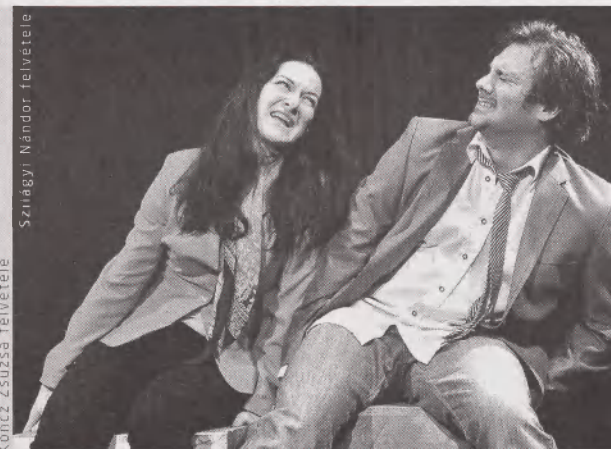
A Naftalin a Radnóti Színházban