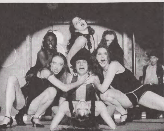
A Cabaret a Centrál Színházban