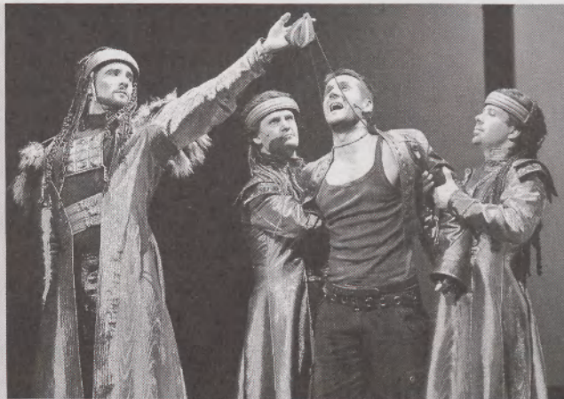
A Jézus Krisztus Szupersztár a Madách Színházban