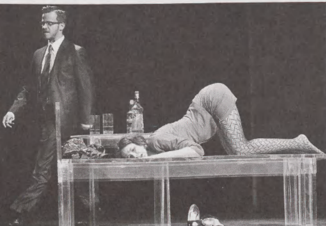
A Tizenegy perc a Thália Színházban

produktumok listája még rövidebb, mint a klasszikusok vagy a félklasszikusok repertoárja; ugyanazok a művek járók körbe az országot, bukkannak fel újra és újra. Ezek között vannak kitűnőek és középszerűek is. Az operett helyzete annyiban sajátos, hogy a műfaj új darabjainak megszületését hiába is várjuk. Új musicalek viszont annál gyakrabban születnek – külföldön. Igaz, néha ünneplünk magyar ősbemutatót is, ám az utóbbi évtizedben talán nem is született olyan magyar musical, amely meg tudott volna kapaszkodni a repertoárban (legjobb esetben a bemutatót vállaló színház játssza sokáig, de egymást követő repri-zekekről szó sincs). A „prózai” bulvár terén is erőteljes