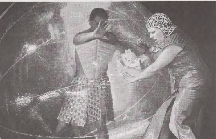
A Mefistofele az Operaházban

A másik két megjegyzés nem esztétikai természetű. Viharos válogatási periódust éltünk meg; míg mi békésen néztük az előadásokat, színházi botrányok, vitatható vagy éppen nevetséges igazgatóválasztások, szétvert társulatok is szegélyezték utunkat. Igyekezünk minderről tudomást nem venni, még akkor sem, ha tudtuk, hogy döntésünk is e kontextusban értelmeződik majd. Próbáltam e visszaemlékezés-sorozat