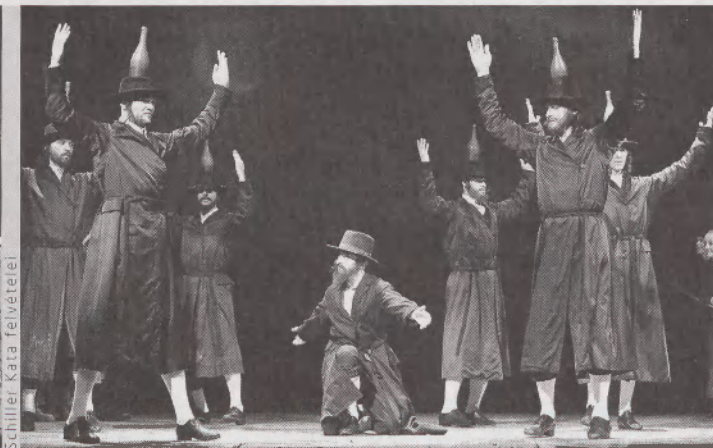
A Hegedűs a háztetőn a Vígszínházban