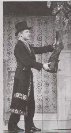
Az Olasz szalmakalap

várt nálunk gyakran övezi sznob lesajnálás – minőségtől függetlenül –, miközben nyilvánvaló, hogy az ilyen típusú előadásokra adják el a legtöbb jegyet. És hogy még ellentmondásosabb legyen a helyzet: az igényes kommersszel is meg lehet bukni, míg az igénytelen gagyival is hatalmas közönségsikert lehet elérni. Sőt, mifelénk nemegyszer előfordul, hogy az előadás minőségével köszönő viszonyban sincs az elért közönségsiker (ami persze megint nem csupán az üzleti célú színházakra jellemző). A teátrumok ennek megfelelően e téren még ritkábban vállalnak kockázatot: a biztos sikerre utaznak, olyan operetteket, musicaleket, bohózatokat vesznek elő, melyeket a publikum jól ismer, s a szerepeket is a lehető legkézenfekvőbb módon osztják ki. (Vagyis egy komoly zenés szerepet az adott színház ehhez alkatban leginkább passzoló sztárja kap meg – jó esetben ez legalább passzol vokális és színészi képességeihez. Látni azért rossz eseteket is...) Így aztán a bemutatott kommersz