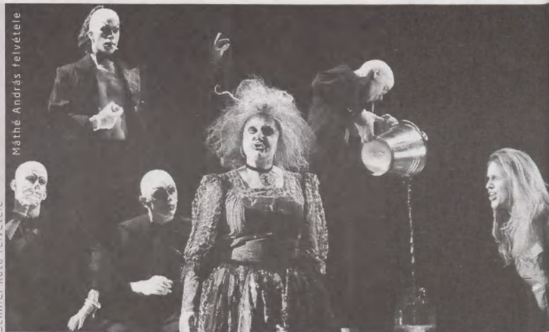
A tüzes angyal Debrecenben