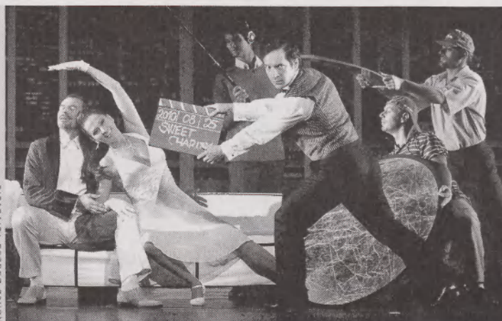
A Sweet Charity a Magyar Színházban