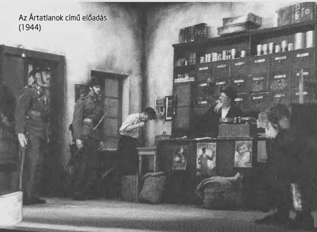
Az Ártatlanok című előadás (1944)

Az előadást a „nagy sikerre való tekintettel” 1944 októberében ismét játszották.