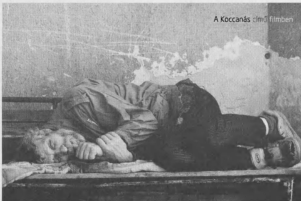
A Koccanás című filmben

A színházi rezervátum különne- mű példánya. Nincs kasztja. Totál egyedül maradt. Nagy filmeket és