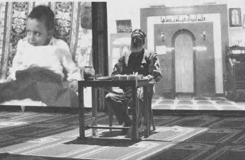
Radio Müezzín (Rimini Protokoll)