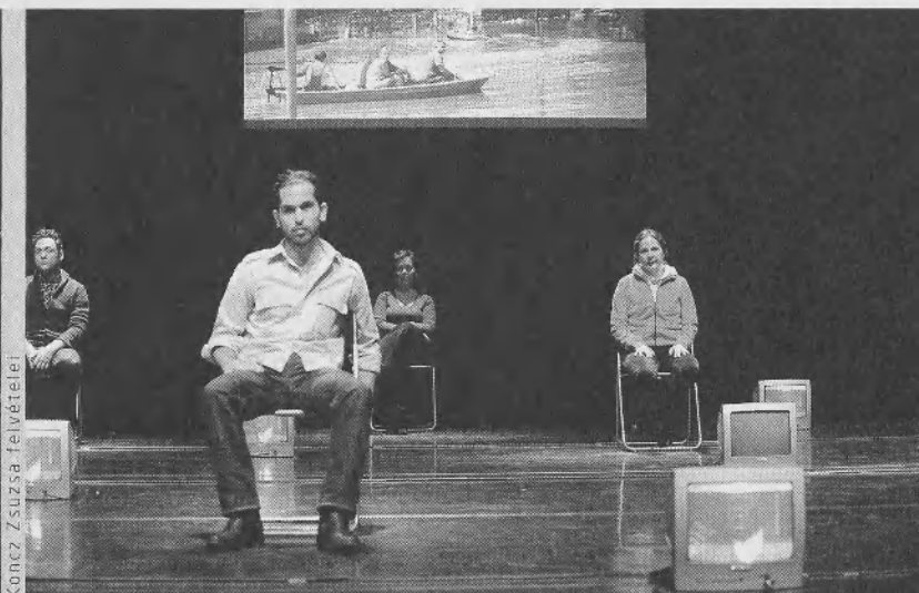
Szóról szóra (PanoDráma)