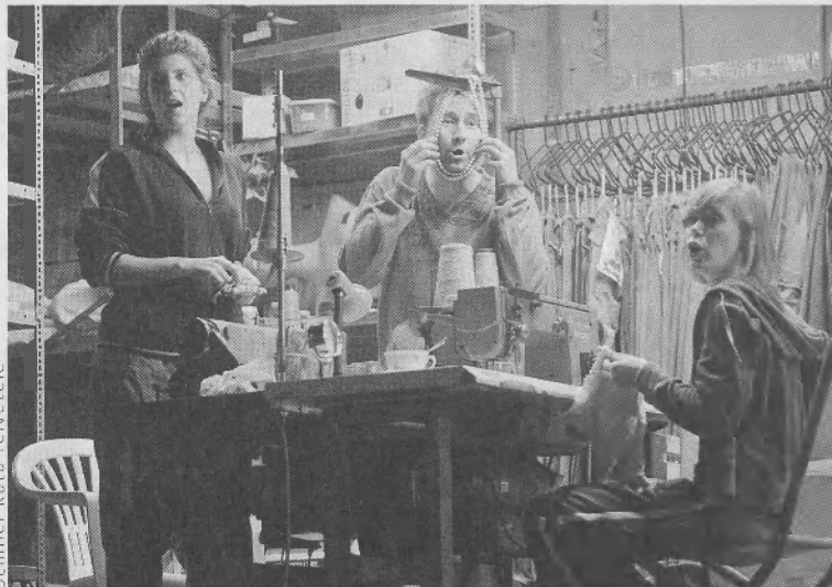
Schiller Kata felvétele

Ami a nemzetközi mezőnyből való válogatás kockázatkerülését illeti, világosan érzékelhető, hogy a külföldi társulatok kiválasztásában, bemutatásában többféle szempont érvényesül: egyfelől fesztiváldíjas elő-