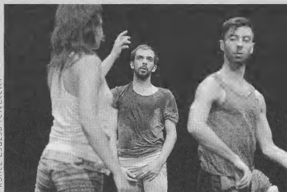
LENT: Basse Danse (Hodwork)