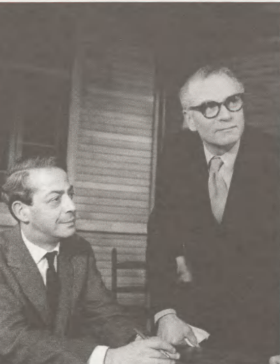
FENT: Denys Lasdun, a National Theatre épületének tervezője és Laurence Olivier