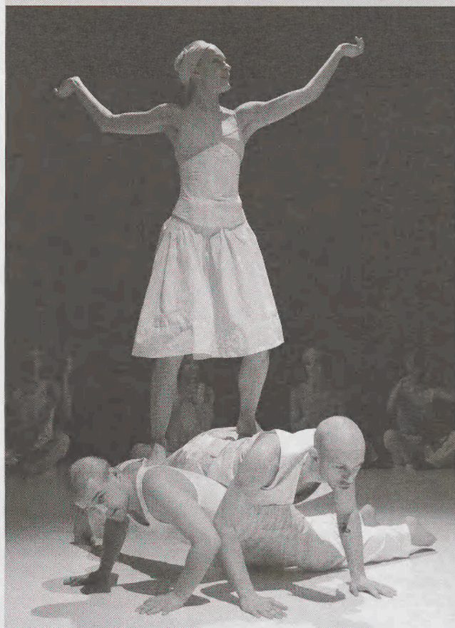
A négyNEGYED a Miskolci Balett előadásában