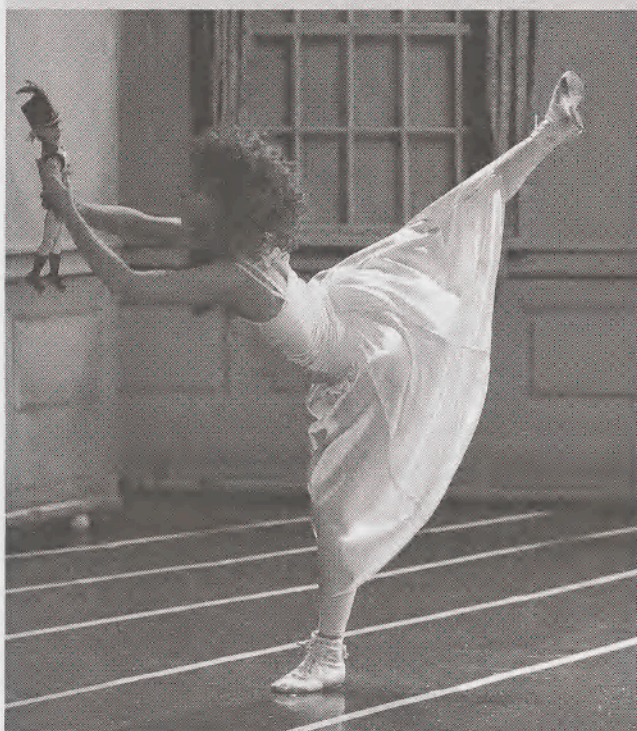
Diótörő (Szegedi Kortárs Balett)