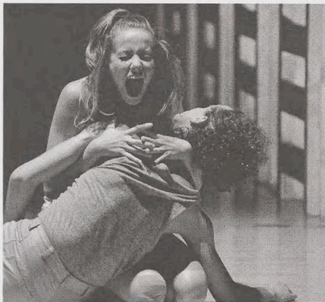
Rómeó és Júlia (Miskolci Balett)