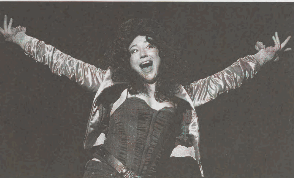
BALRA: A Finitóban