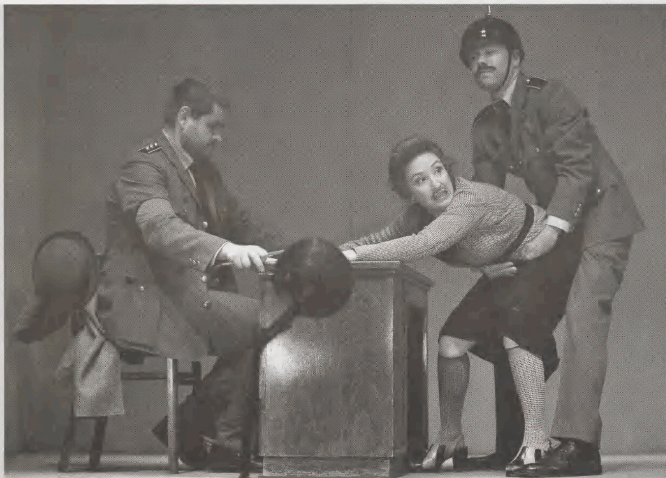
Schiller Kata felvételről