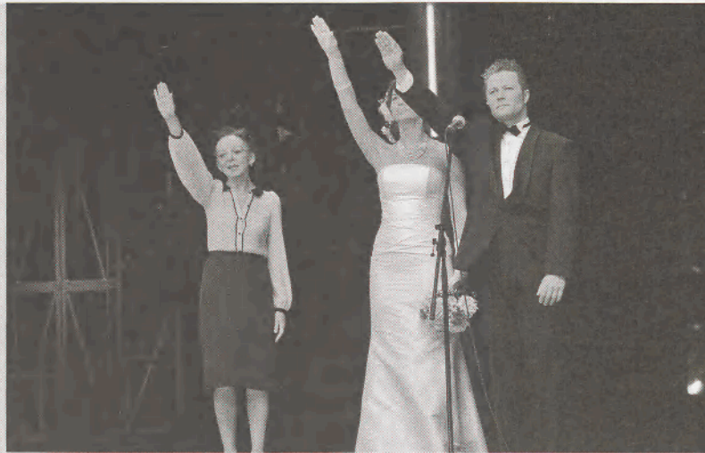
A Mephisto a Nemzeti Színházban

A kurzusszínház másik hivatkozási pontja, hogy a liberális ízlésterror t kell megtörni, mert szerinte ez uralja a színházművészet oktatását, ez deformálja a közízlést. Kritikája célkeresztjében a „rendezői színház” áll, amely át- és félreértelmezi a darabokat, ahelyett, hogy azok eredeti (és persze reménykeltő) mondanivalóját tárná a közönség elé. „Azt gondolom, egy nemzeti kultúrában a színészeket nemzeti szellemben kell nevelni, pont. [...] Én úgy vettem észre, hogy kitűnő színészeket képeznek, de kis rabszolgák. Jól szót fogadnak, igen, rendező bácsi, minden nagyon jó, hú de nagyon balliberálisak, mert azt muszáj” – szólnak e tárgyban Kerényi Imre veretes mondatai. 5 A nemzeti szellem természetesen a külföld által diktált piaci viszonyok miatt sem érvényesülhet. Vidnyánszky Attila ekképp ostorozta a Krétakör Fekete ország című egykori produkcióját: „Tudom, hogy kell összerakni valamit, amire európai menedzserek rácuppannak, csak én nem ilyen vagyok”. 6 S akkor még nem idéz-