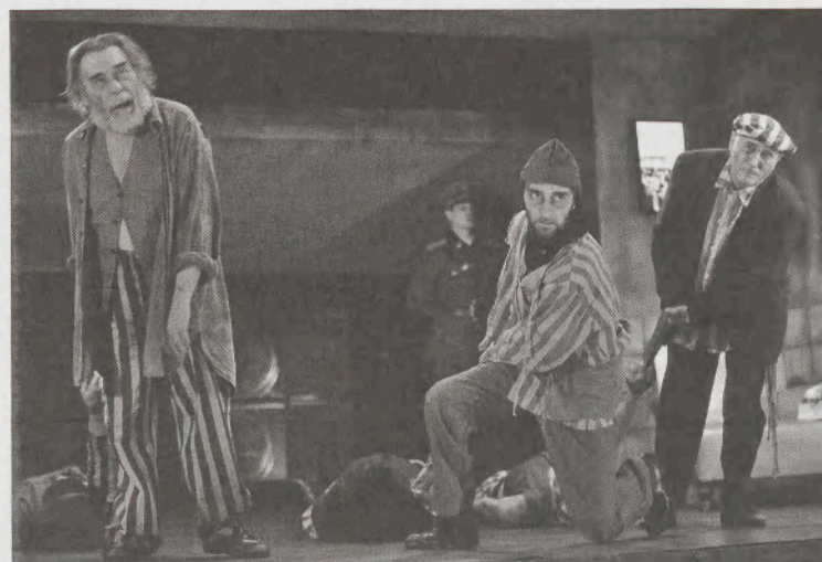
Az álomkommandó a Pesti Színházban

Ebben a közegben értelmezhető a színházra kiosztott szerep is. A misztikus irrealizmus rendszere fenntartja magának a valóságkonstruálás monopóliumát . Mind-