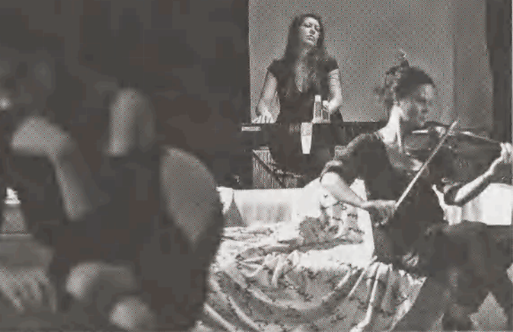
3. Schiller Kata felvétele