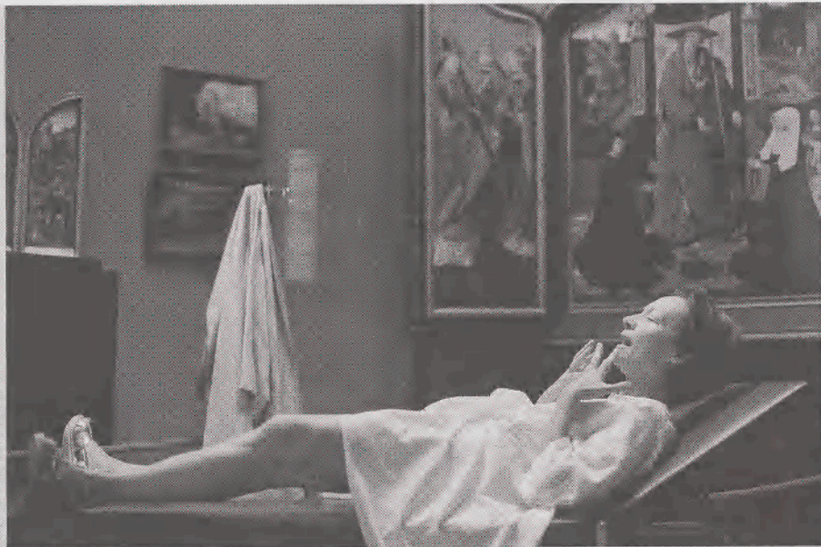
Különdíj: a Ganymed goes Europe alkotóinak