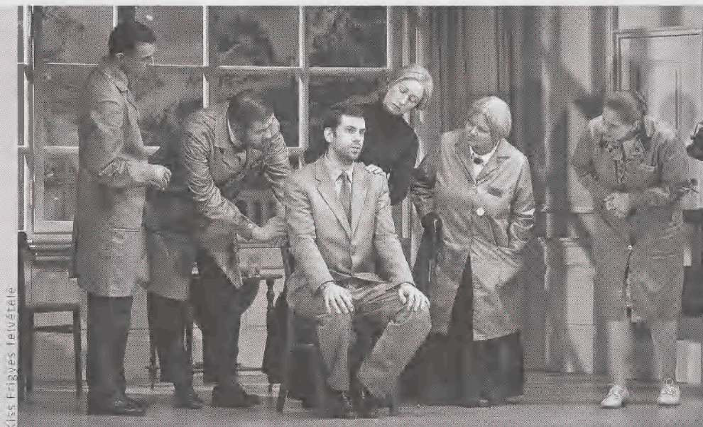
Kiss, Erlyes, felvétel

Rossz idők járnak a magyar drámaírókra, a színházak, ha nem klasszikusokhoz nyúlnak, alig mutatnak be hagyományos kortárs darabokat, inkább adaptációkat vagy saját színházi szövegeket készítenek. (Én is szavaztam ilyen szövegekre.) Székely Csaba művei közül a Bányavízre és a Hogyné, drágám -ra is szívesen szavaztam volna. Eszembe jutott még Tasnádi István ( Memo ), Szabó Borbála ( Nincsen napom, se anyám ) és Kiss Márton ( Csöngő ) neve is. A színházi szövegek közül pedig a Titkaink és A csillagos ég . Nehéz dönteni, hogy a fontos előadásokat a legjobb előadások vagy a legjobb rendezé-