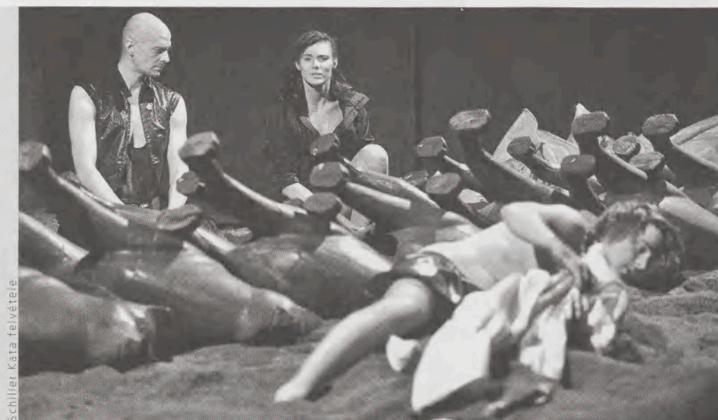
A legjobb független színházi előadás: Irtás (Forte, Székény)