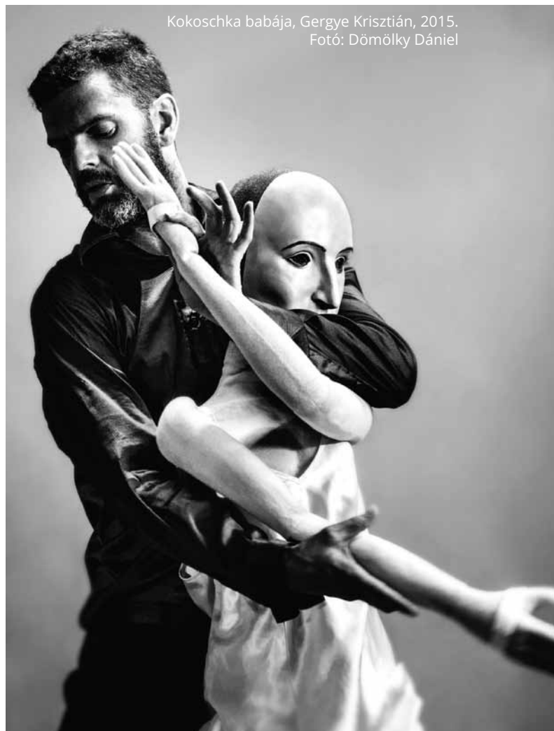
Kokoschka babája, Gergy Krisztián, 2015.

– Krisztián, te a járvány idején elindítottad a Synesthesia video-performansz sorozatot, amelyben képzőművészeti alko-