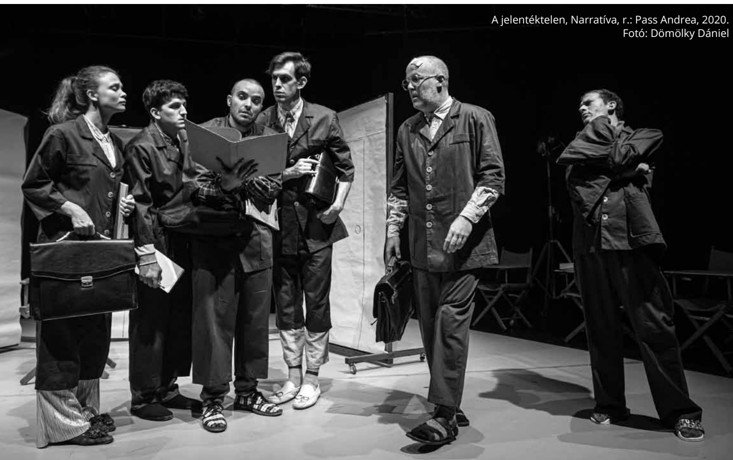
A jelentéktelen, Narratíva, r.: Pass Andrea, 2020.

A társulati lét is egyfajta sziget. Éppen ezért, amikor alternatívát keresgélek gondolatban, egy olyan szakmai együttműködést próbálok felvázolni, amelynek a szerveződését leginkább talán egy mozgaloméhoz hasonlítanám, amelyhez