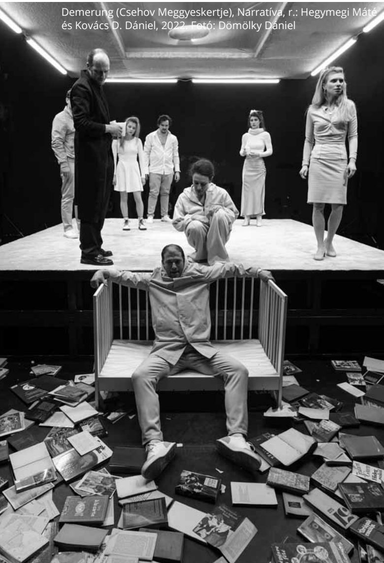
Demerung (Csehov Meggyeskertje), Narratíva, r.: Hegyemegi Máté és Kovács D. Dániel, 2022.

Mi először szerettünk volna letenni valamit az asztalra, és csak utána kopogtatni különböző ajtókon, hogy további forrásokat hajtsunk fel, például a színházkamionra. Az első évadban mindenki egyedül rendezett volna, a saját mániái mentén, a csapattal, az új helyzettel ismerkedve. A második és harmadik évad szólt volna a közelítésről, a közös rendezésről. Előbb páros helyzetekben, hogy eljuthassunk a harmadik évünkben a négy ember közös gondolkodásáig. A kényszerű leállások és az anyagi nehézségek már az első etapot teljesen keresztülhúzták. A Covid alatt mindenki egy kicsit átértékelte a magánéleti és szakmai prioritásait, és kiderült, hogy másfelé tartunk. A velünk dolgozó elkötelezett emberek iránti felelősség meg persze a csapat lendülete, alkotói kedve miatt úgy döntöttünk, hogy mi ketten továbbvisszük a Narratíva művészeti vezetését. Egyedül, illetve ketten nyilván nem menne, rengeteg segítséget jelentett korábban az ESZME, most pedig a FÜGE. A működésünk kiszámíthatóbb lett. Van egy állandó hely, a Jurányi, ahol játszhatunk és próbálhatunk. Van egy stáb mögöttünk, és öt színésznek ebben az évben már fel tudtunk ajánlani egy jelképes, félállásnak megfelelő szerződést. Ezt nagyon szeretnénk tartani, sőt bővíteni. Egyelőre biztató a helyzet, és úgy tűnik, működtethető ez a struktúra, de bármikor felboríthatja egy újabb lezárás vagy egy kultúrpolitikai döntés. Ezzel a bizonytalansággal nagyon nehéz minőségi módon hosszabb távra tervezni. A kiáltvány pontjai irányo-