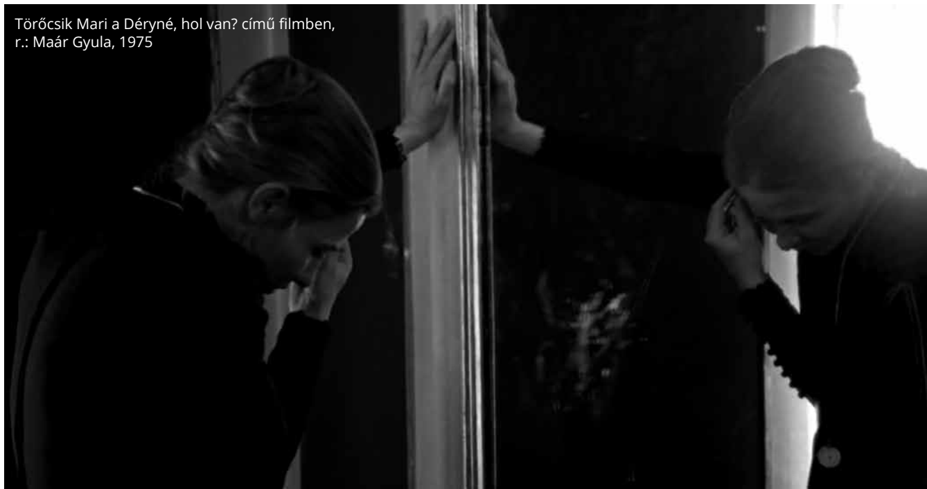
Törőcsik Mari a Déryné, hol van? című filmben, r.: Maár Gyula, 1975

Aztán – önironikusan – így fejezi be a történetet: „Ez így volt. Istenem! akkor kacagtam rajta s most, midőn az öregséghez mindenféle fájdalmas betegségek, szakgatások csatlakoznak, nem jut eszébe senkinek, hogy: bizony sok nyavalyát gyűjtöttél magadba öregségedre, jó asszony!”