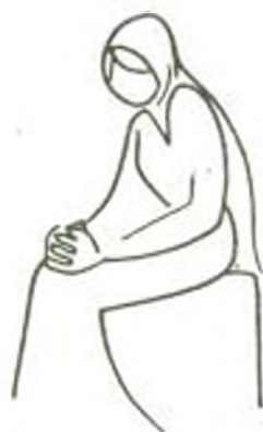
Imhol az Úrnak szolgálója Lukács 1,38

Két adventi ember van az Újszövetség elején: Mária és Keresztelő János. Nagy különbség van kettőjük között. De egyik abban, hogy mindegyikük a Megváltót várja, mindketten örülnek a Megváltónak. Mária énekkel magasztalja az Urat, János prédikál róla. Ne tartsuk ezt véletlennek. Egy nő és egy férfi áll előttünk a várakozásban.