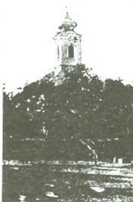
Az 1824-ben felépített templom

Méretek tekintetében az ósok évszázadnyi távlatban tervezettek. Igen, a