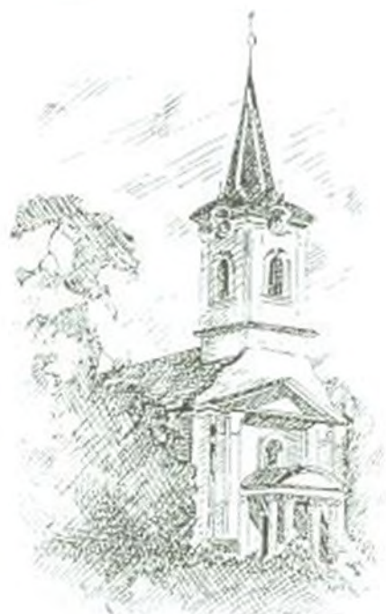
A templom mai formája