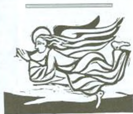
Illés Árpád festő- és grafikusművész metszete