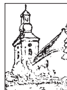
A csúzai templom rajza, a jugoszláviai Énekeskönyvből

Az előadásom témája a „ Presbiter szolgálata a gyülekezetben ” volt, melyet megbeszélés követett.