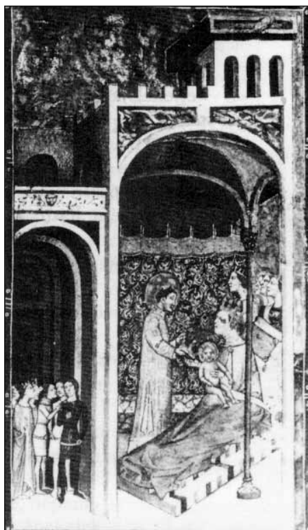
Vajk (a későbbi Szent István) születése 970 körül (Képes Krónika, Széchenyi Nemzeti Könyvtár, Budapest)

netet az új hűbéri-gazdasági munkarendbe. Az egymásraaltságot nemcsak a szükség hozza magával, hanem megfelel a római pápaság általános törekvésének, amely célul tűzte ki az európai népek, sőt az egész emberiség egyesítését, tekintet nélkül azok nyelvi és származási különbségeire. Ezt az univerzális célt a nagytróró szász, Liudolfinger-házból származó, „Ottó-dinasztia” is követi, amely a „római császárságot” kívánta visszaállítani –