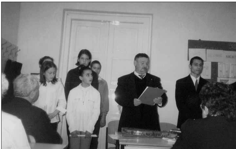
Taktabáji gyerekek a konferencián