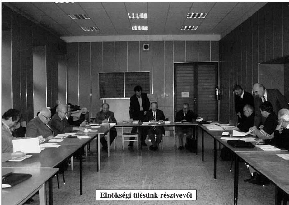
Elnökségi ülésünk résztvevői