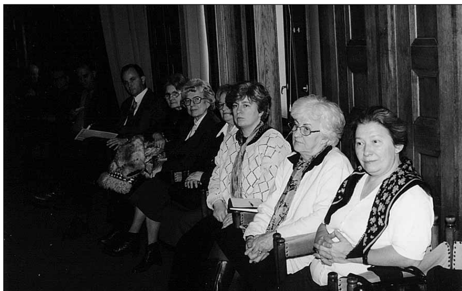
Női presbiterok a közgyűlésen