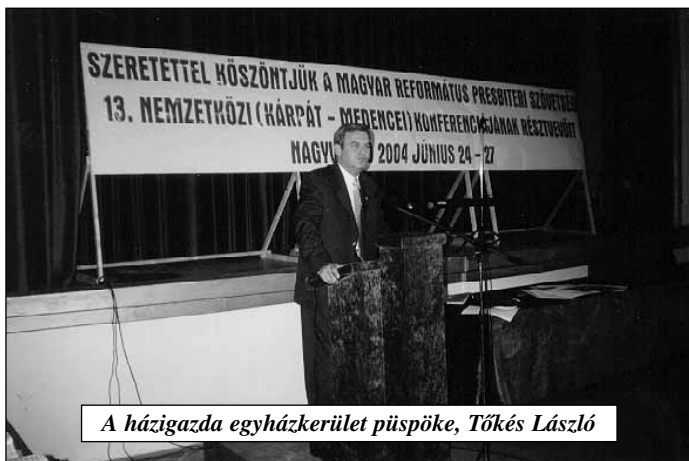
A házigazda egyházkerület püspöke, Tőkés László

Ilyen tradicionális elemek lehetnek egyházi életünkben azok az élettelen, iratlan szabályok, amelyek a múlt egy időszakában akár a megmaradást, az Ige tiszta hirdetésének megőrzését is szolgálhatták, de mára értelmüket veszítették.