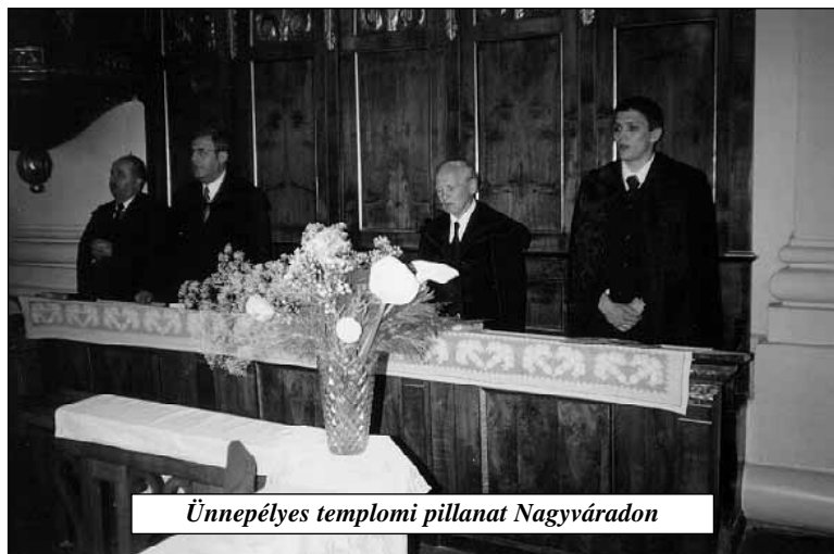
Ünnepélyes templomi pillanat Nagyváradon