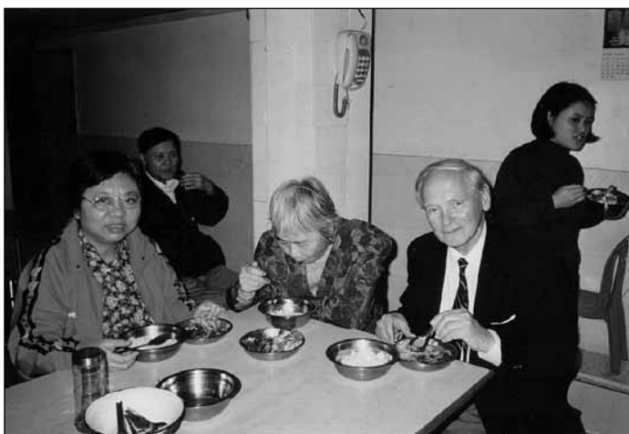
Közös ebéd a szolgálatok szünetében kínai protestáns presbiterekkel és gyülekezeti munkás testvérekkel Dél-Kínában