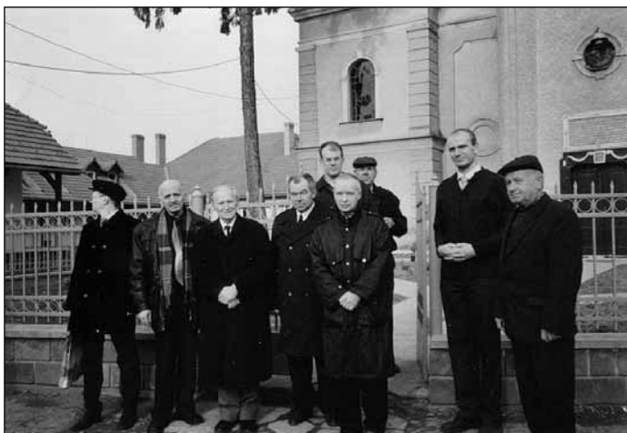
Moszkvai és szentpétervári református presbiterok a kárpátaljai Nagydobronyban vendéglátóikkal, útban Magyarország felé