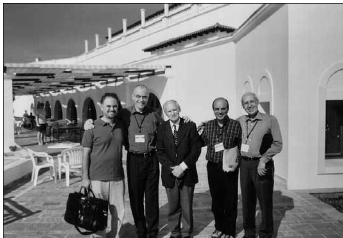
Török és görög református presbitérium lelkipásztorokkal egy Athén melletti konferencián, kiknek látogatását várjuk ebben az évben