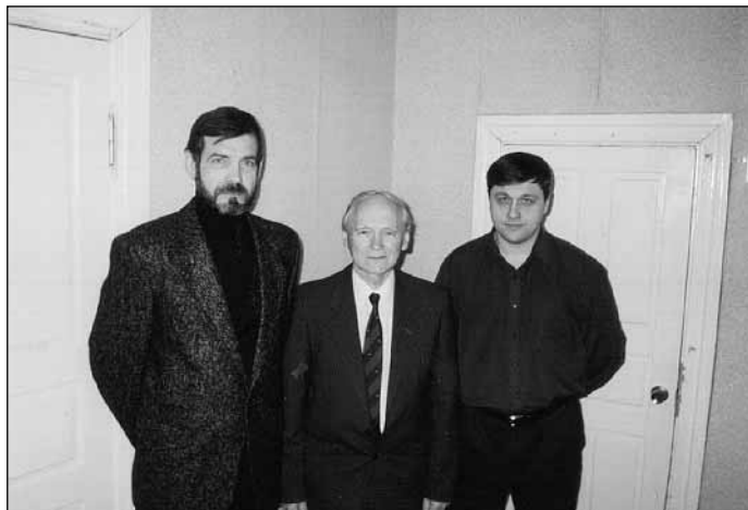
Az oroszországi református kálvini hitvallású gyülekezetek három nagy városban alakultak meg az elmúlt tíz évben: Moszkvában, Szentpéterváron és Tverben (Tver Moszkvától mintegy 200 kilométerre van). A képen tveri presbiterok láthatók, az igen jól szervezett, élőhitű gyülekezet munkásai