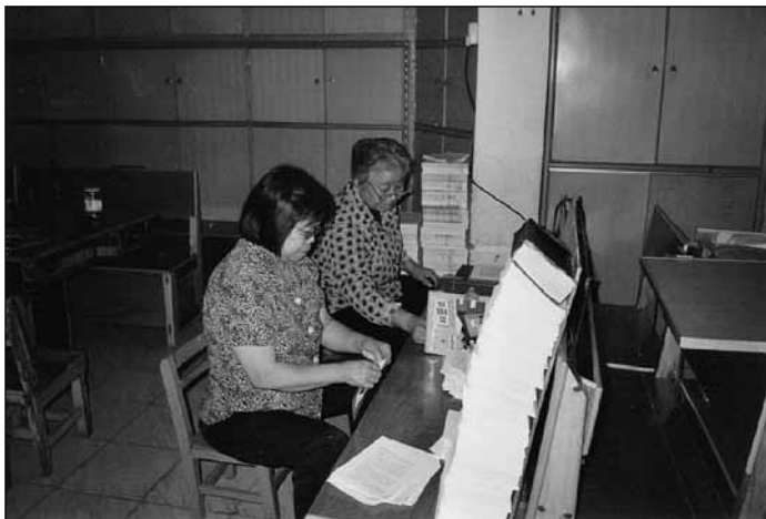
Kínai presbiterok, gyülekezeti vének, akik a kinyomatott szolgáltatásokat fűzik egybe egy nagyon egyszerű imakörben, Dél-Kínában

Gyakran adunk hírt arról, hogy a presbiteri szövetség kapcsolatai hogyan szövik át az egész Kárpát-medencét. Isten azonban távolabbi helyekre is elvitte elnökünket az elmúlt esztendőben, ahol szintén gyülekezetekkel, lelkipásztorokkal, presbiterekkel és a pásztor munkáját segítő gyülekezeti tagokkal találkozhatott.