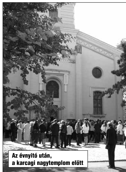
Az évnyitó után, a karcagi nagytemplom előtt