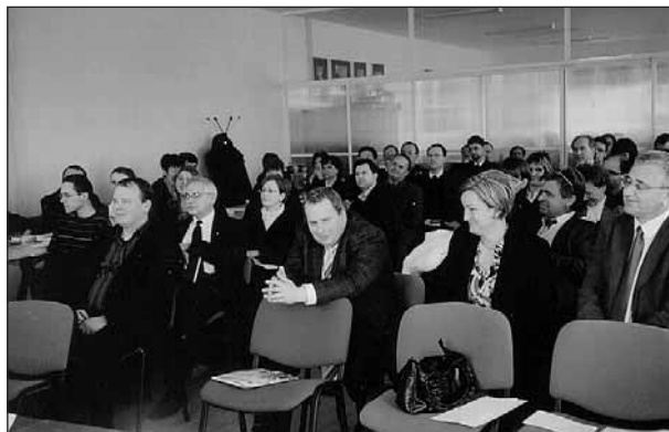
Hanva – Gömörországi konferencia (2011. április 13.)