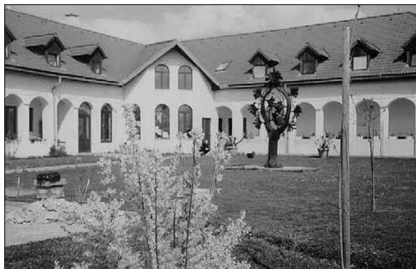
Hanva – Református Diakóniai Központ