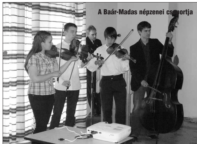
A Baár-Madas népzenei csoportja