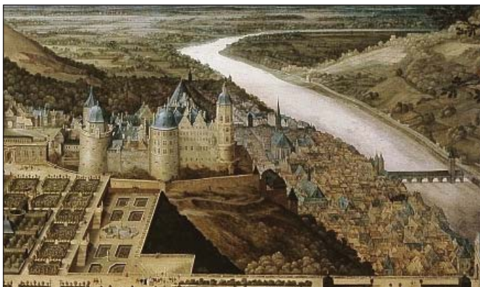
Heidelberg a Káté keletkezésekor