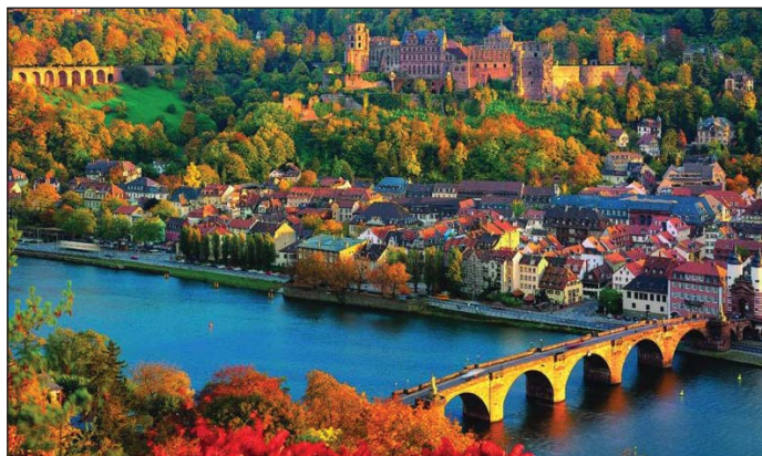
A Káté szülővárosa ma