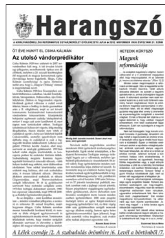
A Lélek csendje (2. A szabadtéri imáshely 16. Levél a börtönből 17.

A Mozaik rovatban Csúry István püspök Bogya Miklós igehirdetéseit tartalmazó kötetet ajánl az olvasók figyelmébe. „Levél a börtönből” címet viseli az a cikk, melyben lelkipásztorát szólítja meg egy büntetését töltő atyafi.