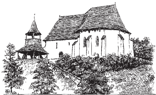
A SZÁSZMÁTÉ TEMPLOM