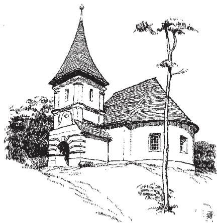
A HARCSÓRFEL TEMPLOM

Első évben közel száz templomot mért fel. Centiméter pontossággal. Még a fedélszékeket is megörökítette. Felméréseit azután Kolozsvárott rajztáblán kidolgozta. Munkáját hihetetlen energiával és fáradhatatlan szorgalommal végezte. Erdély szegény volt. A református egyház még szegényebb. Így hát apostoli hűséggel és módszerrel járta a vidéket. Apostolok lován, azaz gyalog. Pontos