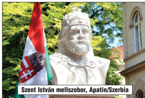
Szent István mellszobor, Apatin/Szerbia

Ezért akart olyan egyházat, amelyik senki mástól ne függjön, csak a Krisztustól. Ezért vetett alapot egy olyan államszervezet számára, amely a király és a nemzet hatalmi egyensúlyában a rend és szabadság örök feszültségét feloldotta és egyiket a másikkal biztosította. Ezért indított meg egy olyan társadalmi fejlődést, amely az uralkodó osztályokat alulról és kívülről mindig friss vérral táplálja; azért tette életparancsá a magyar számára: európaivá lenni s mindig jobb magyarrá lenni – Európa érdekében.