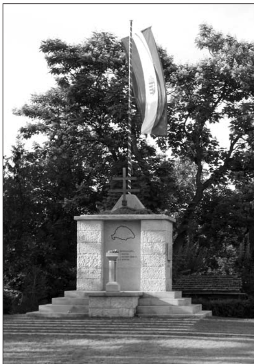
Csillaghegyi Országzászló. Felavatták 2012. június 4-én, a Nemzeti Összetartozás Napján. Csillaghegy, Petőfi Sándor tér

A lesújtó béke sok mindenben megakadályozhat bennünket, magyarokat. Jobb ruházatban, élelemfogyasztásban