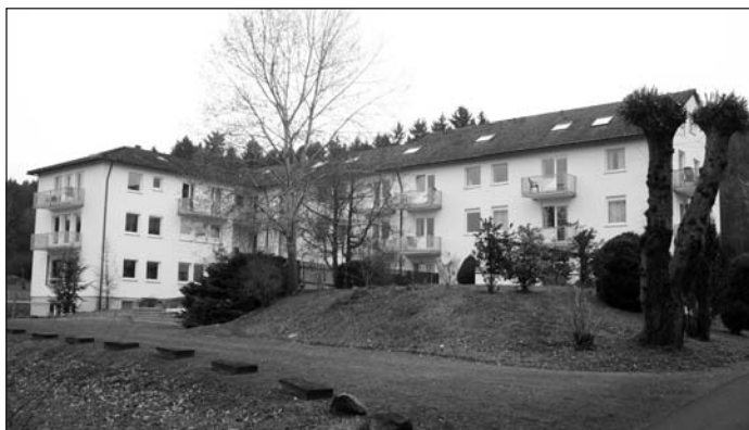
Holzhausen-Burbach, Blaues Kreuz

Az Európai Magyar Protestáns Gyülekezetek Szövetsége március 18-20. között immár 14. alkalommal rendezett konferenciát a diaszpórában élő magyar protestáns presbiterek részvételével. Németországban, Holzhausen-Burbach-ban 2003 óta találkoznak a Nyugat-Európai Protestáns Gyülekezetek presbiterei, hogy sajátos – évi rendszerességgel megrendezésre kerülő – presbiterképzésükön egymás hite által épüljenek, szeretetben együtt legyenek és nem utolsó sorban közösen tanuljanak. (Az EMPGYSZ 2015 őszén, a svájci Beatenbergben megtartott közgyűléséről előző lapszámainkban közöltünk részletes beszámolót.) A konferencia Holzhausen-Burbach festői szépségű, erdőkkel övezett részén, a Blaues Kreuz konferenciaházában került megrendezésre. Ennek magyarországi megfelelője a Magyar Kékkereszt Egyesület, református egyházunkban Iszákos-mentő Misszió néven ismert. A modern felsze-