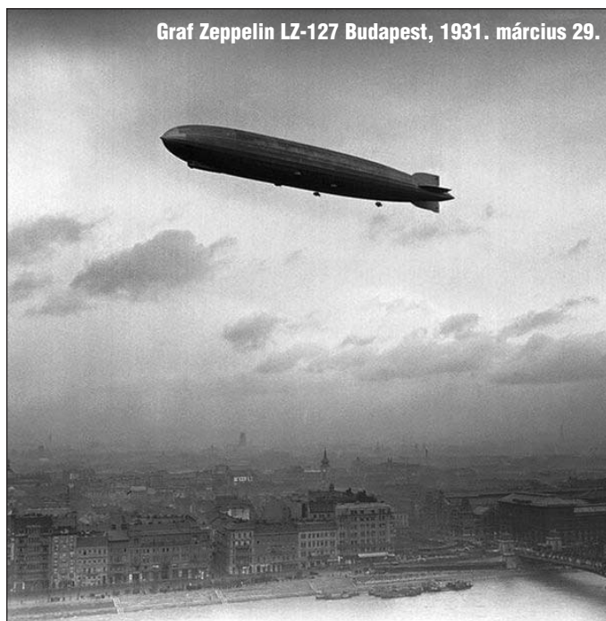
Graf Zeppelin LZ-127 Budapest, 1931. március 29.

Nem szabad megfélekedezni arról, hogy a betegek- és fog- lyokkal való törődésre az Úr Jé- zus az „utolsó ítélet”-ről szóló Ige szerint nyomtatékosan fi- gyelmeztet minket, saját elő- nyünkre azt lelkünkre kötve! A szeptember 1-jén életbelépő belmissziói zsinati törvény ezekre nézve is általános irány- elveket szab, hátra van azonban ennek gyakorlati megvalósí- tása.”