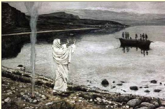
Amint kiszálltak a partra, paraszat láttak ott, rajta halat és még kenyeret is (János 21,9)

A jánosi leírás és a James Tissot (1836–1902) francia hívő festő szentföldi útján alkotott 800 akvarelljének egyike szerint is a Feltámadott Úr ott áll a Tibériás-tenger partján. Takart arcával a tanítványok felé néz, mindkét kezét hívó mozdulattal emeli fel: „JÖJJETEK!” (Ján 21,12). Ebben a mozdulatban, hívásban minden benne van. Jézus azért jött a világra, hogy megkeresse, megtartsa és hazavigye azt, ami az övé, ami elveszett (Luk 19,10). Isten gyermekeit – akiket az Atya örök tanácsvezetésében kiválasztott és Őneki adott. Ezzel a mozdulattal látták őt a kisgyermek, amikor hívta őket: Engedjétek hozzám jönni a kisgyermeket..., mert ilyeneké az Isten országa (Luk 18,16). Ilyen magához, Istenhez hívó mozdulattal állt meg a betegek, tisztátalanok előtt, a megálázottak és megszorítottak előtt: Jöjjetek énhozzám mindnyájan, akik megfáradtatok... (Mát 11,28). És ilyen mozdulattal tárta ki végtusájában karját a kereszten, mintha onnan is ezt üzenné: Jöjjetek, Atyám áldottai, örököljétek az országot, amely készen áll számotokra a világ kezdete óta (Mát 25,34). Földi tartózkodásának utolsó mozdulata is áldásra tárt karjai voltak, mennybevitelkor: Felemelte a kezét, és megáldotta őket. És miközben áldotta őket... felvitette a mennybe (Luk 24,50-51). És most itt, ebben a hajnali, didergető derengésben is. Ott áll a gyönyörű, kéklő, hárfa alakú tó partján. Amit éppen ezért neveztek el Kinnerethnek, másképpen Genezáreti tónak. A Talmud, a zsidó