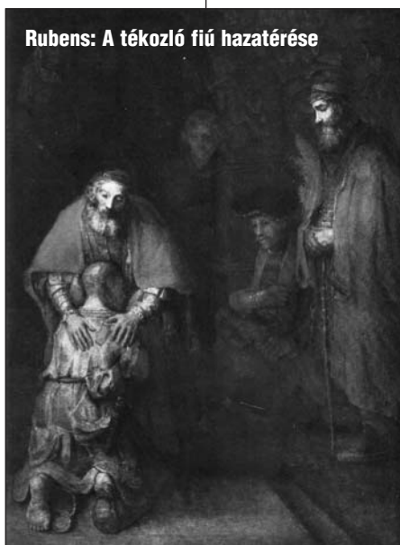
Rubens: A tékozló fiú hazatérése

A bűn felismerését követi annak megvallása és megbánása. Ezt legtöbbször a gyülekezet együttesen teszi bűnbánó imádságban. Úrvacsorai istentisztelet előtt sok gyülekezetben szokás bűnbánati istentiszteleteket tartani, ahol gyakran a lelkipásztor fel is sorolja a Tízparancsolat egyes pontjainak, valamint Jézus új parancsolatainak a megszegését, mint megvallandó bűnöket, mintegy ráébresztve a gyülekezeti tagokat saját bűneik felismerésére. Ilyen közös bűnbánó alkalmak előfordulnak az Ószövetség könyveiben is, gondoljunk csak a Benjámin törzse elleni hadjáratra (Bír 20,26), vagy amikor Jósias király idején megtalálják a törvénykönyvet, és azt felolvassák az egész nép ítéletére (2Krón 34,30), vagy a hazatértek közös bűnvallására Ezsdrás idején (Ezsd 10,10-11).