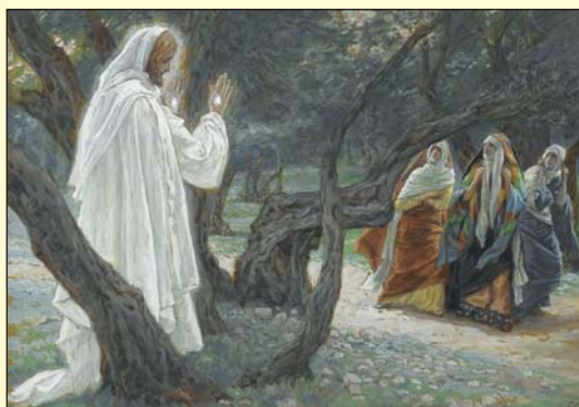
J. Tissot (1836–1906) francia festő Jézus élete c. sorozatából