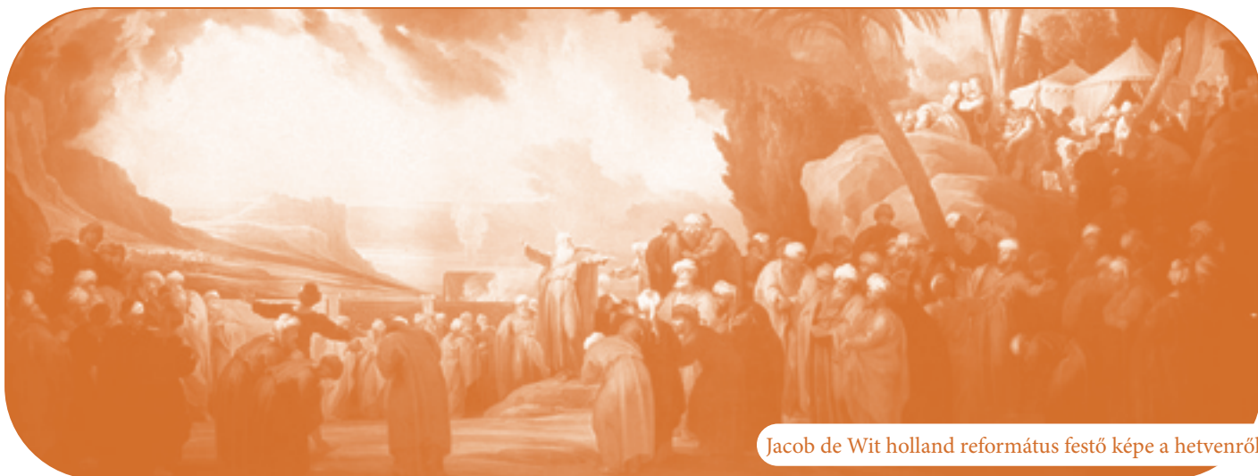
Jacob de Wit holland református festő képe a hetvenről

Gyűjts össze nekem hetven férfit Izráel vénei közül... Akkor leszálok, és beszélek ott veled. Elveszek abból a lélekből, amely rajtad nyugszik, és rájuk is kiárasztom, hogy veled együtt hordozzák a nép terhét, és ne hordozd azt egyedül. (...) Bárcsak az ÚR egész népe proféta volna, és rájuk is kiárasztaná lelkét az ÚR! (4Móz 11,16-29)