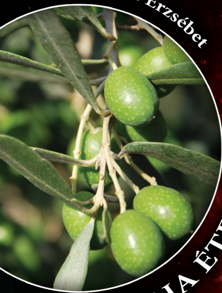
A BIBLIA ÉTELEI