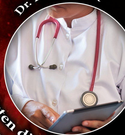
Isten dicsősége az orvos szemével