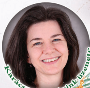
Karácsonyi énekeink zivene