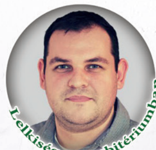
Lelkiség a presbitériumban