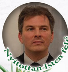
Nyitottan Isten felé