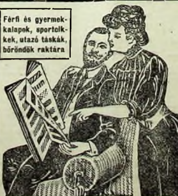
Férfi és gyermekkalapok, sportcipők, utazó táskák, bőröndök raktára

1000 vég Ó-budai különlegességű váazon, 1 vég 25 mtr. 20 korona helyett 13 korona. Paplan és alsólepedő váazon egy szélybe 1 koroná 50 fillértől métere.