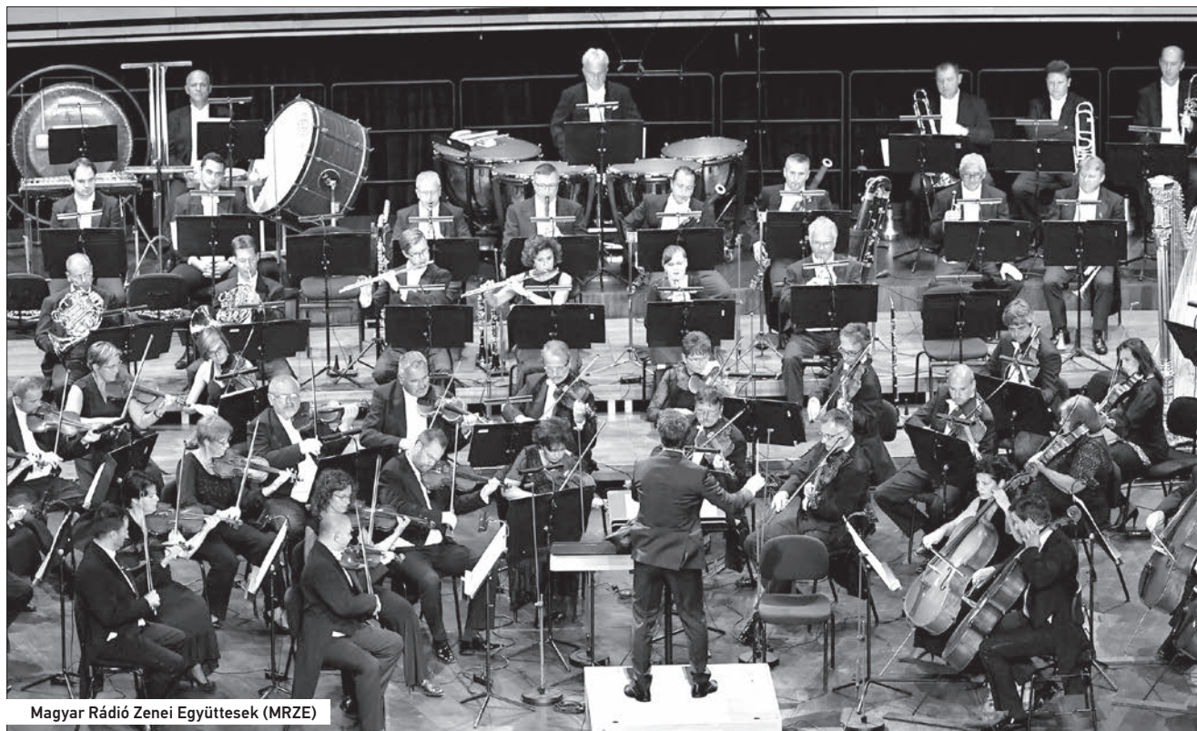
Magyar Rádió Zenei Együttesek (MRZE)

Az ország egyik legnagyobb kulturális eseménye a Debreceni Virágkarnevál. Több tízezer turista érkezik ilyenkor a városba. Az egy héten át tartó rendezvénysorozaton minden évben, immár hagyományosan jelen vagyunk mi is egy-egy rendhagyó koncerttel. Idén Ünnepi nyitány című műsorunkkal vártuk a teltházas közönséget