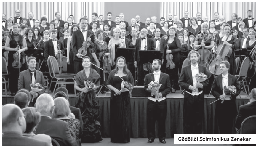
Gödöllői Szimfonikus Zenekar

A Verdi- Requiem nemcsak nagy tutti-kat és markáns szólista-megmozdulásokra alkalmas részleteket tartalmaz, de igényes megformálást követelő hangszer-szólók sokaságát is felvonultatja. Ezek többségükben vállalható színvonalon, kulturáltan kidolgozva, méltó kifejezőerővel szólaltak meg – példaként említhetem többek közt a Quid sum miser obligát fagottszólamát. A kórus sokszínű és sokárnyalatú dinamikával énekel, a pianókban kifinomultan, de a nagy fortékat is bírva zengéssel. Természetesen számos részlet jelezte, hogy a Gödöllői Szimfonikus Zenekar vonós-kara előtt még sok munka áll, van mit csiszolni, korrigálni, van hová fejlődni – ezt jelezte az Offertorium elejének bizonytalanokodó intonációjú csellószólama, ugyanitt később (a signifer Sanctus