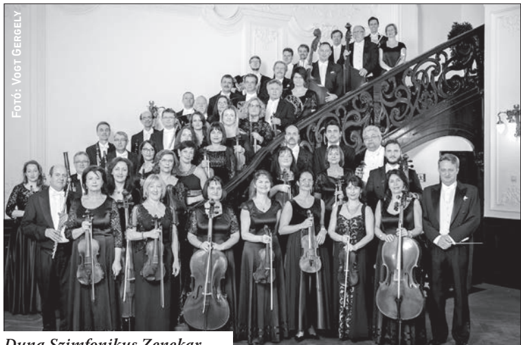
Duna Szimfonikus Zenekar