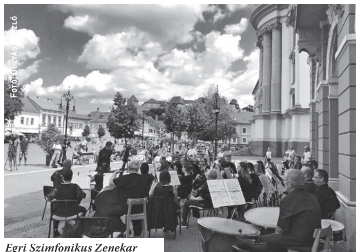
Egri Szimfonikus Zenekar

A populárisabb zenére vágó is szimfonikus köntösből hallgathattak népszerű hazai és külföldi slágereket a már negyedik egri Szimfonikáljk show-n augusztus 20-án, melyet a városi ünnepség és a tűzijáték keretezett. A Dobó teret betöltő, mintegy 5000 fős közönséggel ez lett a leglátogatottabb és az egyik legnagyobb népszerűségnek örvendő rendezvénye az egri zenekarnak a nyáron.