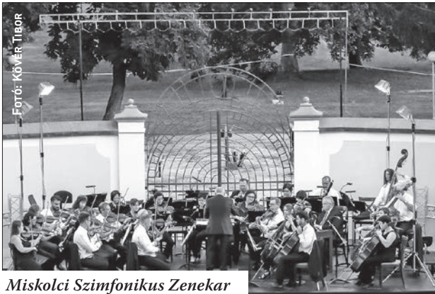
Miskolci Szimfonikus Zenekar