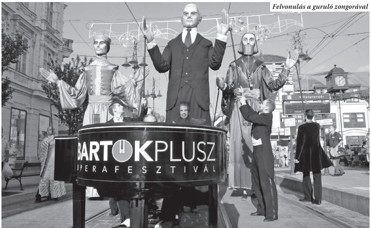
Felvonulás a guruló zongorával

Sok-sok változáson ment keresztül a fesztivál. Időszakosan és évről-évre. Mindig megújult, más-más lett, de a lényegét megőrizte: tíz napnyi zeneünnep. Hét éve a