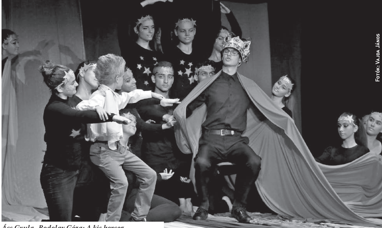
Ács Gyula–Bodolay Géza: A kis herceg

gerek sora, elegancia és jó hangulat.” A műsorfüzetben ezt garantálta a fesztivál szervező gárdája és tartotta magát az ígérétehez. Szólisták voltak: Sümegi Eszter Kossuth-díjas szoprán énekesnő és Paulo Ferreira portugál tenor. A Pannon Filharmonikusokat dirigálta Bogányi Tibor.