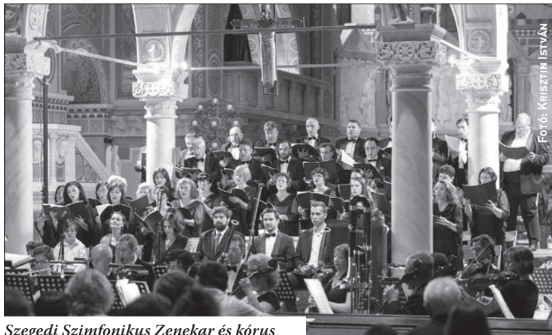
Szegedi Szimfonikus Zenekar és kórus

tartó sorozat sikere bizonyítja, hogy – amint ez a Szabadtéri Játékok kezdeti éveiben is így volt – a színházi előadásokon túl a klasszikus zenei koncerteknek is helye van a Dóm tér nyári kínálatában. Teljesen érthető, hogy a könnyű műfajú zenés darabok, operettek, illetve ma már elsősorban a musicalek vonzzák a legtöbb nézőt, de jó érzés évről évre átélni, hogy több ezres, elképzelt és hűséges tábora van a komolyzenének is Szegeden (s egyébként sehol másutt nem ül együtt az országban négyezer néző klasszikus zenei programot hallgatva).