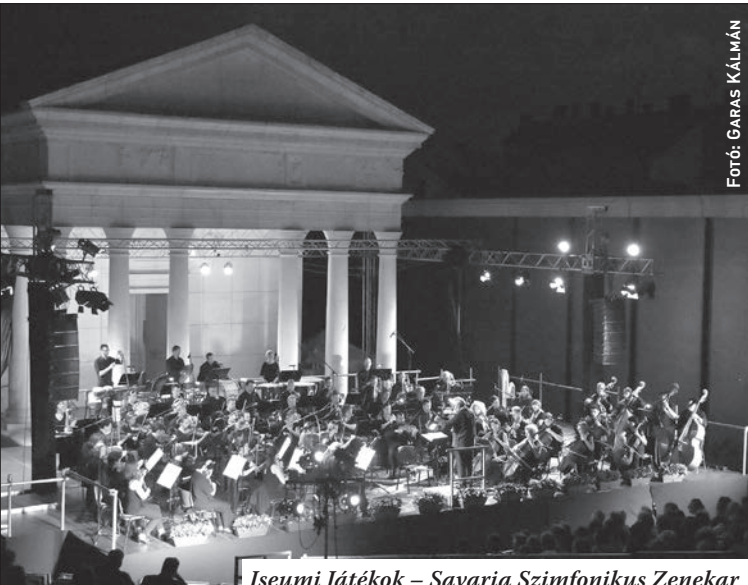
Iseumi Játékok – Savaria Szimfonikus Zenekar

dik alkalommal adta elő ezt a csodálatos alkotást, a mostani produkció kiemelkedőnek számít az előző előadások közül is, mely egyaránt volt köszönhető a szerepeket kiválóan megszólaltató és a színpadi játékban is kimagaslót nyújtó szólisták és a Hamar Zsolt által karmesterként művészileg teljesen kontrollált zenekar együttműködésének, amihez még a helyszín különleges jellege is fontos adalékul szolgált. Az évad egyik legjobb hangversenyét hallhatták az érdeklődők.