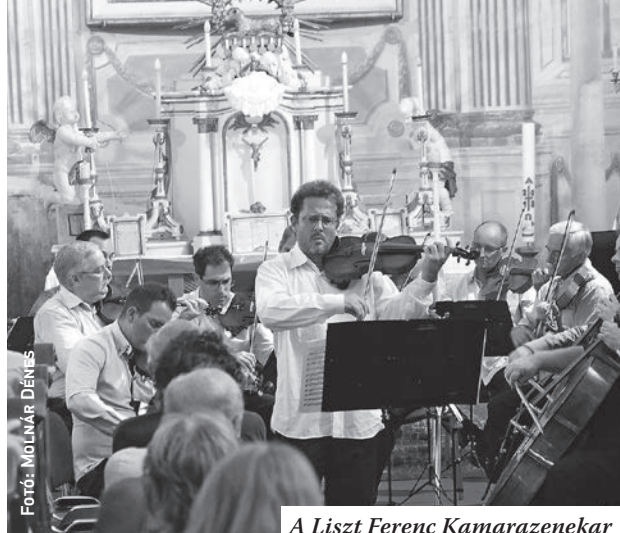
A Liszt Ferenc Kamarazenekar

Mischa Maisky, aki az idei Isztambuli Zenei Fesztiválon életműdíjat is kapott, már többször koncertezett a Liszt Ferenc Kamarazenekarral Budapesten, Olaszországban, Svájcban és az utóbbi pár évben egyre sűrűsödtek a közös hangversenyek. Az életműdíjat a magyar vonósenekar fellépése elején adták át, ami különleges alaphangot adott a koncertnek. Az 1948-ban a Szovjetunióban született Mischa Maisky az egyik legtöbbet koncertező, legtöbbet díjazott csellista a világon, s az egyetlen, aki Gregor Piatigorszkijtól és Rosztropovicstól is tanult. Utóbbi Maiskyt a fiatalabb generáció egyik legkiemelkedőbb tehetségeként méltatta (a jövő Rosztropovicsaként is emlegették), aki gyönyörű finomsággal és költészettel ötvözi nagyszerű temperamentumát és briliáns technikáját. A legkeresettebb csellistaként Maisky fellépett már a világ valamennyi rangos koncerthelyszínén a legkitűnőbb zenekarokkal és szólistákkal.