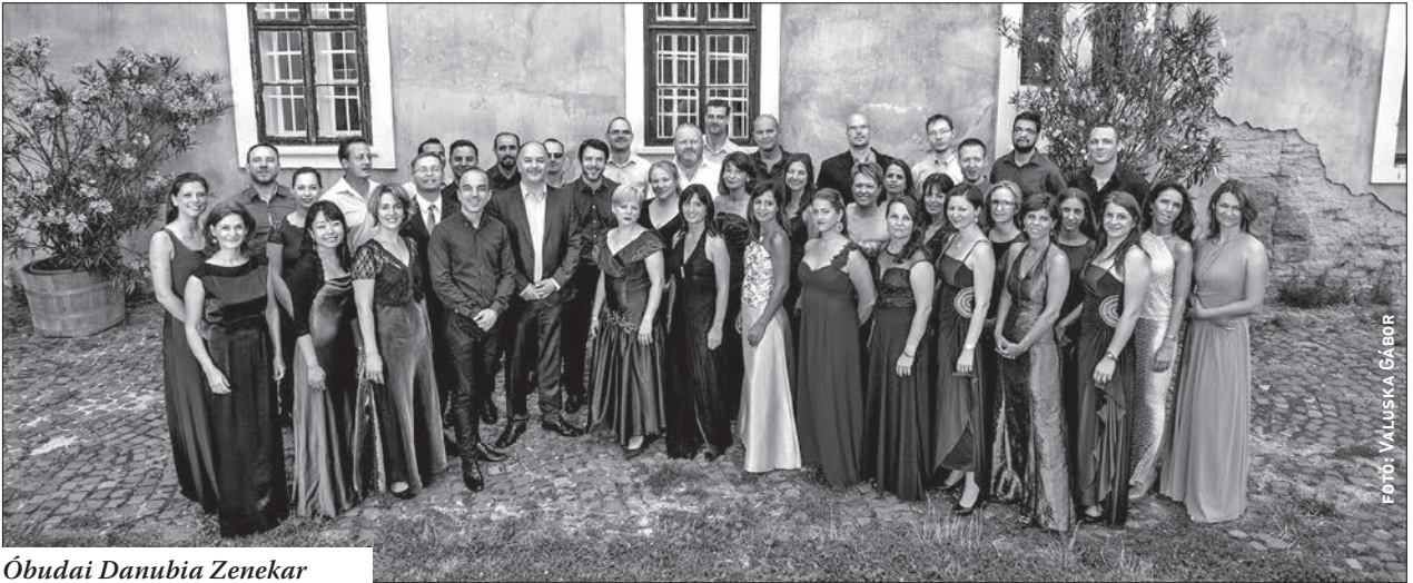
Óbudai Danubia Zenekar

felállásban, az Óbudai Danubia Zenekarral kiegészülve lépett fel a Margitszigeti Szabadtéri Színpadon, az ismert Quimby-dalok eddig sosem hallott változatban, szimfonikus átíratban csendültek fel.