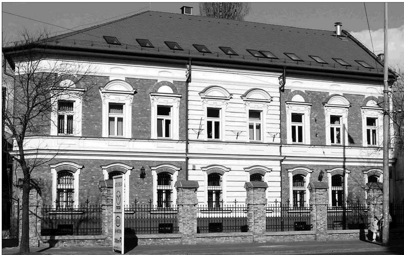
A Művészeti Szakszervezetek Szövetségének új székháza

szek, filmesek, képzőművészek, írók szakszervezetei, továbbá zenész alapszervezetek, az OSZK rendezkedhettek be.