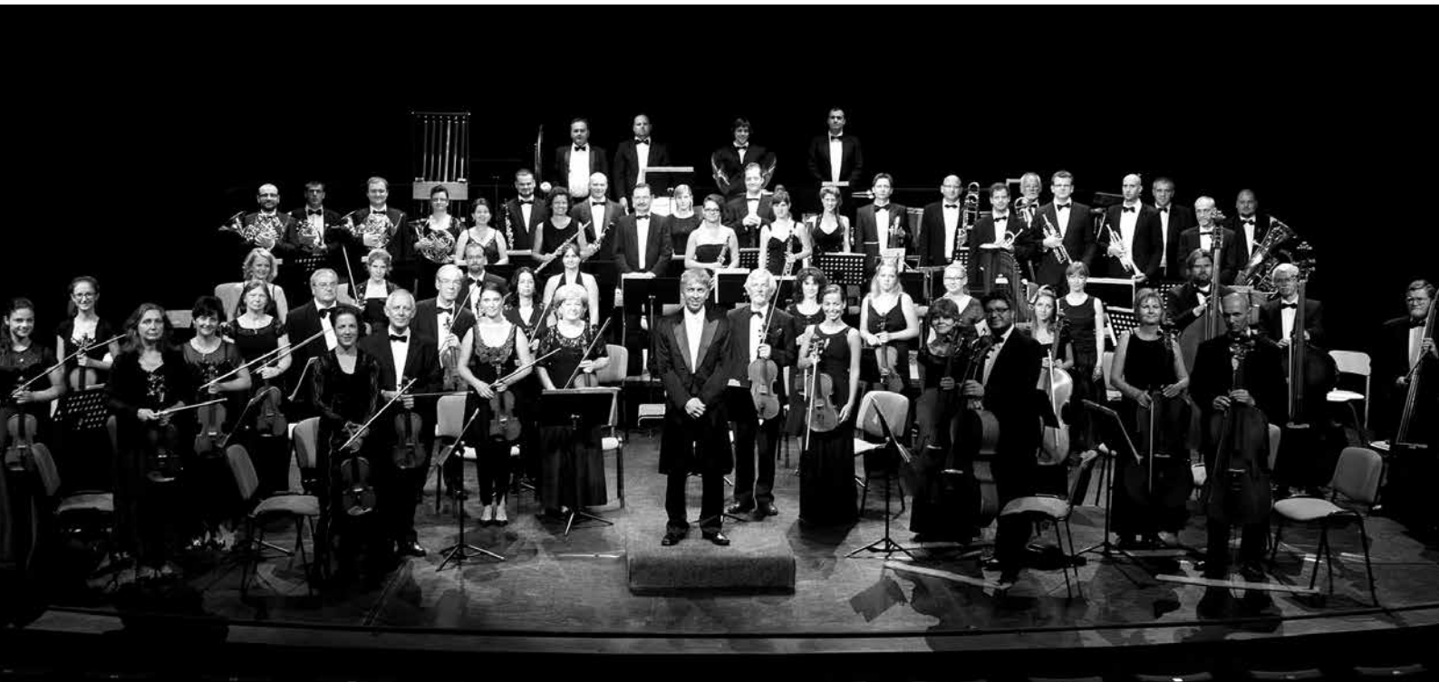
A Kecskeméti Szimfonikus Zenekar

korábban megkezdett munkát, ezért a pénzhiány ellenére – öntevékeny módon történő muzsikálással – átmentették a zenekart ezeken a nehéz időkön. A gondok ellenére nagyon szép és jelentős időszak volt ez... Nekem húsz évvel ezelőtt az volt a feladat, hogy szervezeti és szakmai megalapozottsággal újraépítsem az együttessé az akkori zenekari tagokból.