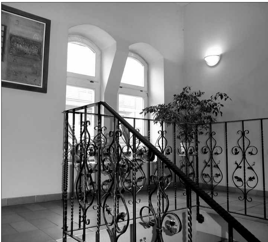
Vörösvári út 101.

„Helyileg nem a diplomata negyedben van, mint a korábbi székházunk, de a világ számos pontján jártam már, s a szakszervezeti székházak máshol sem a legelítettebb kerületekben kaptak helyet... Amikor másik székházat kerestünk, akkor nem szerettem volna modern irodaházat. Ott ugyanis túlságosan a funkció dominál, és az ilyen épület általában nem alkalmas arra, hogy jelképezze a szervezetet. A Vörösvári út 101. alatt található, klinkertéglás épület is komoly múltra tekintethet vissza, még a K. und K. korszakban lett ez a hadsereg tartalék hadtáp területe. Óbudai Malomnak is hívták a helyet, s két majdnem egyforma épület található egymás mellett, amelyek irodaháznak épültek már eredetileg is a Fasori épülethez hasonlóan, az 1910–20-as években, és közülük mi megvásároltuk az egyiket. Itt a 2000-es évek elején megtörtént már egy komoly felújítás, s ennek megfelelően lettek kialakítva a terek, és relatíve megfelelő volt a gépészet is. Ezért többé-kevésbé minden a helyén van, s viszonylag jó állapotban vásároltuk meg. Természetesen végeztünk azért mi is jelentős felújítást, hogy