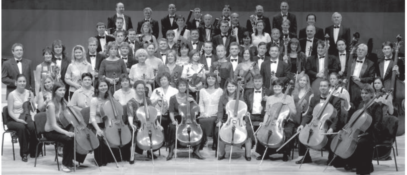
A Szolnoki Szimfonikus Zenekar

sztéseinket, további új lehetőség után kutatva.