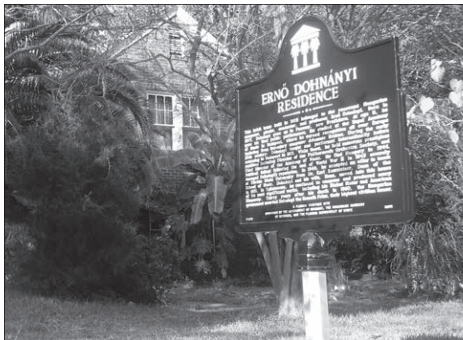
Dohnányi Ernő emléktábla Tallahassee-ben

nyelt. Míg a 2014-es csomagokat a Magyar Tudományos Akadémia ajándékként kapta Seàn McGlynnntől, addig az egyetemen elhelyezett letéti anyagért 60 000 dollárt fizettünk az örökösnek. Ezt is az NKA Ithaka-programjának köszönhetően tudtuk megvalósítani.