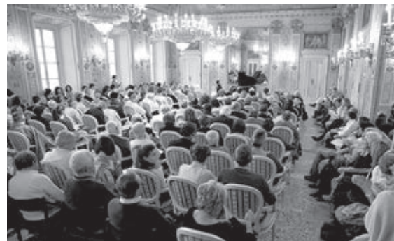
A comói színház „Fehér szalonja”, a konferencia helyszíne

tette. Sokan hangsúlyozták a tanárok folyamatos képzésének, valamint a művészek és a tanárok közötti együttműködésnek a fontosságát. Ugyancsak többen említették a meglévő intézményhálózat, illetve az erre épülő networking szükségességét, az adott művészeti intézmény szoros kapcsolatát a helyi önkormányzattal, társ kulturális intézményekkel, valamint oktatási intézményekkel. Úgy tűnt ez utóbbi leginkább Nagy-Britanniában okoz gondot, ahol a nagyon különböző státuszú intézmények és önkormányzati rendszer miatt régióként markáns különbségek adódhatnak egy-egy program megvalósítási esélyeit tekintve.