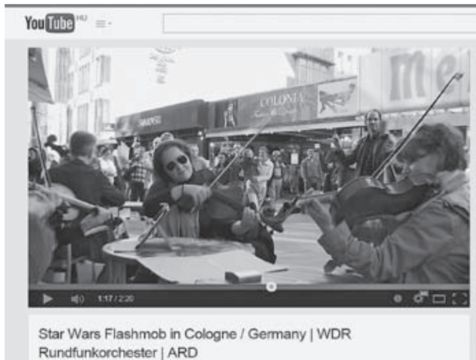
Star Wars Flashmob in Cologne / Germany | WDR Rundfunkorchester | ARD

Több mint két millióan látogatták a Kölni Rádiózenekar (WDR Rundfunkorchester Köln) falsbmobját: http://www.youtube.com/watch?v=sTHXlZHPyqE