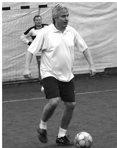
Példamutató labdakezelés a MÁV Zenekar igazgatójától

úgy véltem, ennyivel el lehet indulni. De ahogy terjedt a hír, egyre többen jelentkeztek, végül nyolc csapattal szerveztük meg a kupát. A budapestiek közül szinte mindenki eljött, hiszen részt vett a foci bajnokságon a Dohnányi, a Rádió, a Concerto, az Opera, a Nemzeti, a MÁV és a Fesztiválzenekar, s akadt egy kakukk-tojás csapatunk is, a Honvéd Kórus együttese. Szerettem volna kórusokat és kamarazenekarokat is hívni, de ez az első körben, a szervezési idő rövidsége miatt nem sikerült.