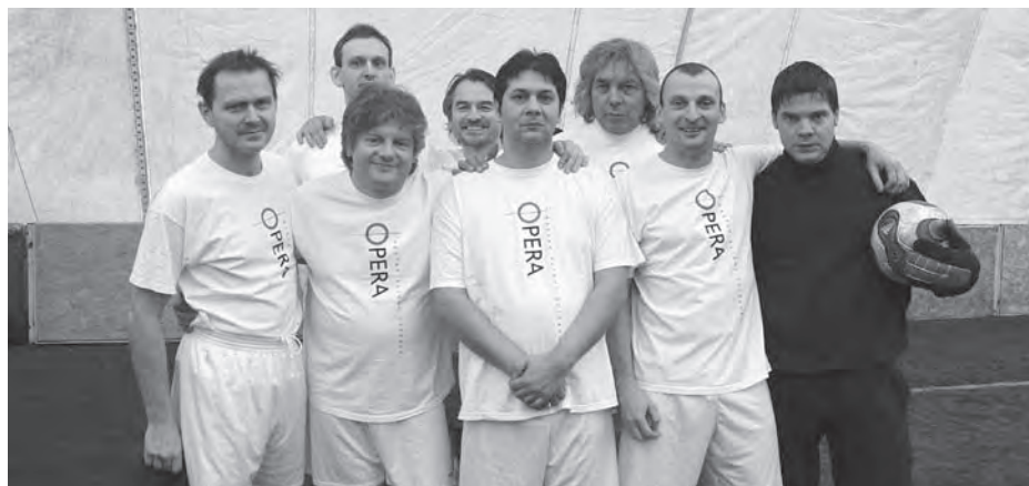
A harmadik helyezett Opera csapat

ball-bajnokságra, ahol remek volt a pálya és a szervezés. Ezért megkértem, segítsen a hely lefoglalásában, s emellett a Concerto Budapest csapatát toborozza össze. Egyetlen hét alatt szinte minden megszerveződött. Lett a fűtött, műfüves sátor, a terembérlés a nevezési díjából gyűlt össze, s a játékvezetői díjakat is ebből finanszíroztuk. A játékosoknak fejenként körülbelül ezer forintot kellett fizetniük. Először négy zenekarról volt szó,