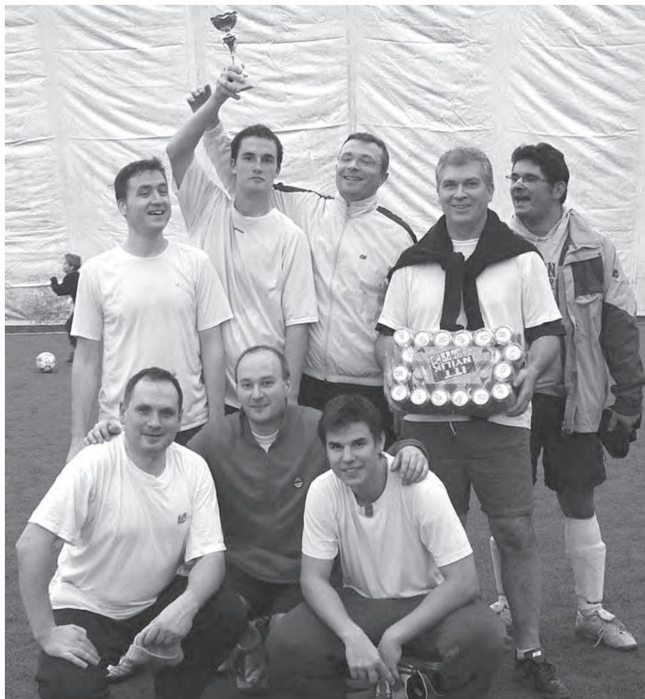
A győztes rádiós csapat

– Évek óta gondolkodtam rajta, hiszen konzervatóriumos korom óta nagyon sok zenésszel focizom rendszeresen. Számomra nagy szerelem a futball, hiszen hatéves korom óta napi szinten játszom, egy időben döntennem kellett a foci és a hegedű között. Bár a három gyerekem miatt most már nem játszom minden nap, de azért amikor tehetem, mindig eljárom az edzésekre. Rengeteg kolléga focizik különböző bajnokságokban, tudtunk egymásról, de a saját zenekaruk válogatottját még sosem szervezték meg, mivel ez több munkát igényelt volna, és senki sem kívánt ezzel foglalkozni. Azzal viszont tisztában voltam, hogy az Operások a tánckarral, a kórossal, a zenekarral minden szezon végén, zárásként játszanak egymással. Innen merítettem az ötletet, s persze abból, hogy néhány tapasztalt kolléga mesélte, régen, évtizedekkel ezelőtt ennek óriási hagyománya volt, a budapesti szimfonikus zenekarok között létezett anno futball-kupa. Ez-