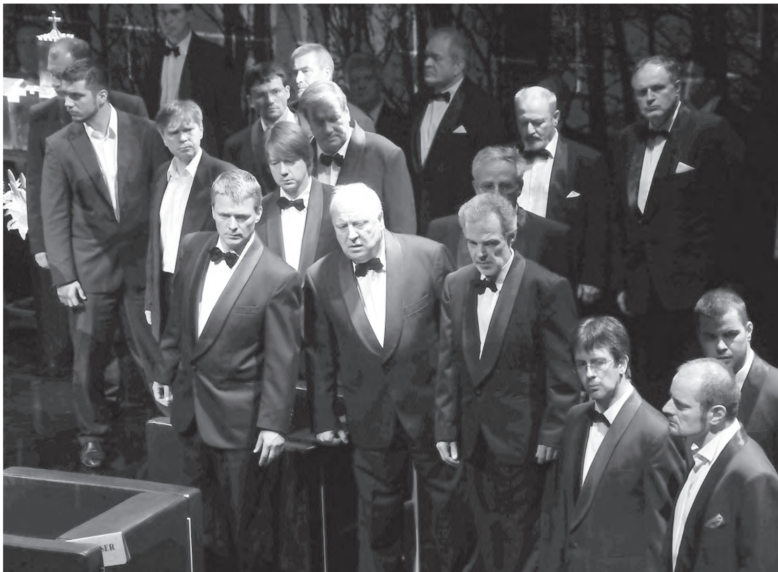
A Rádió-, és az Operakórus a Tannhäuser előadásán

sünk, de közös célt szolgál, nevezetesen a hazai népzene és az ebből táplálkozó világzenei irányzatok nemzetközi megismertetését, promotálását.