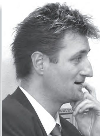
Mérei Tamás Savaria Szimfonikus Zenekar