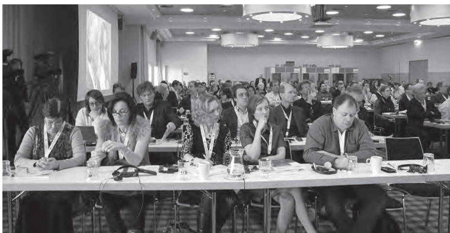
Pillanatkép a konferenciáról

– Így igaz, s a munkaszerződésekkel kapcsolatban több, mint különös volt arról hallanom, hogy ahol nem közalkalmazotti vagy hosszú távú szerződéssel foglalkoztatják a zenészt, ott is az úgynevezett önfoglalkoztató forma dívik. Ilyen a négy nagy londoni zenekar, amelyek kft-ként működnek. A tulajdonosok maguk a zenekari tagok, s ők gondoskodnak a járulékok befizetéséről. Az a forma, amelyet nálunk a törvény is tilt, hogy valaki vállalkozóként nyújtana szolgáltatást egy zenekarnak, jószerivel ismeretlen.