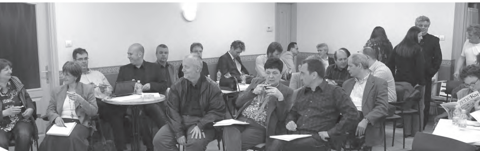
Munkáltatók és munkavállalók cserélik ki gondolataikat az Előadó-művészeti Törvényről